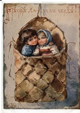
В тесноте, да не в обиде!