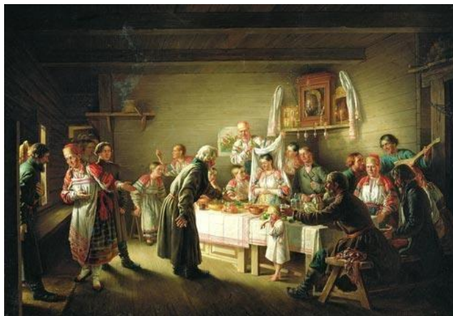
Н. Петров. «Смотрины невесты»