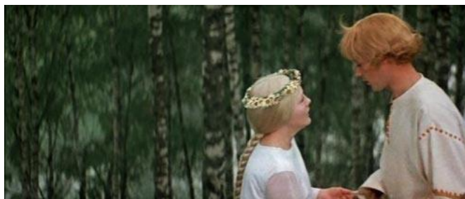
Кадр из фильма «Снегурочка»

Белый цвет у славян символизировал чистоту и невинность, но одновременно являлся траурным. Девушка, покидая родительский дом, символически «умирала» для своего рода, переходя в другой – своего мужа, чтобы здесь «воскреснуть» уже в новом статусе, превратившись из девочки в женщину, жену, хранительницу очага, будущую мать. Поэтому – и смена фамилии, отсюда – и традиция непременно назвать свекровь и свекра мамой и папой.