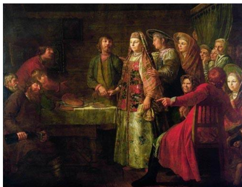
М. Шибанов. «Празднество свадебного договора»