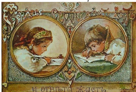
Сердце сердцу дать и ответа ждать!