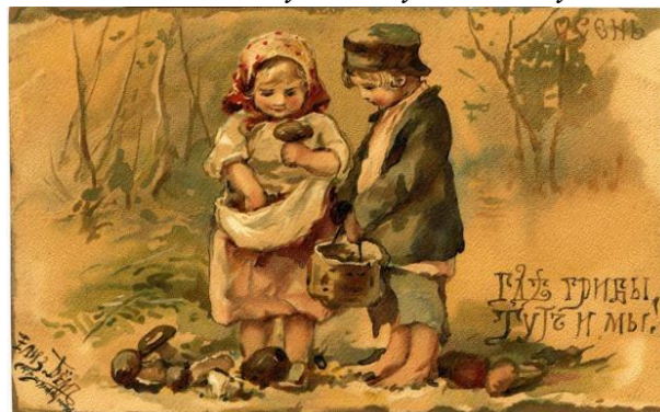
Где грибы, тут и мы!