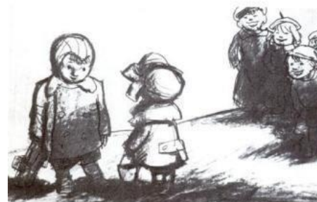
- Жених и невеста!

Коля, Коля, Николай Тили – тили тесто, Сиди дома не гуляй. Вот я и невеста! К тебе девочки придут Март прошел, и май проходит... Поцелуют и уйдут. А жених все где-то бродит.