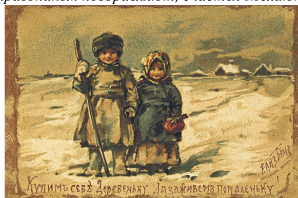
Купим себе деревеньку, да заживем помаленьку!