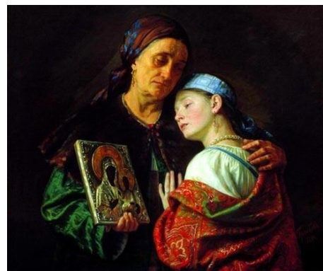
С. Грибков. «Благословение на свадьбу»

В качестве приданого невеста приносила в новую семью перины, постель, подушки, одежду, различную домашнюю и кухонную утварь. Богатая семья могла дать в приданое дочери недвижимость, землю, драгоценные украшения.