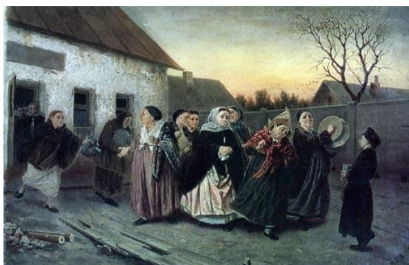
В. Перов. «Накануне девичника. Проводы невесты из бани»