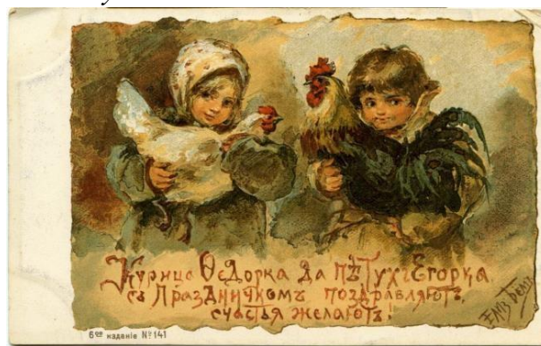
Курица Федорка, да петух Егорка с праздником поздравляют, счастья желают!