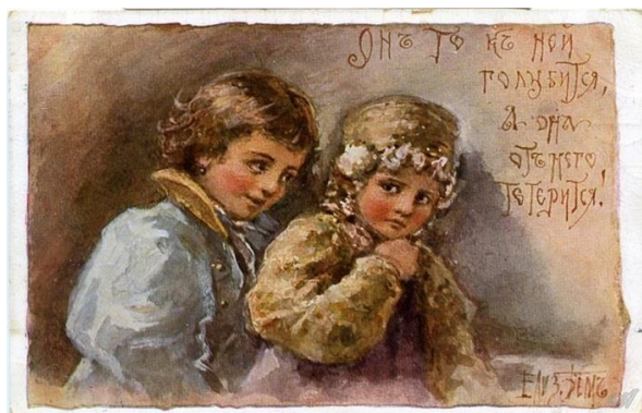
Он то к ней голубится, а она от него тетерится!

За двадцать лет активной творческой деятельности Елизавета Бём создала более 300 сюжетов для открыток, многие из которых отражают нежность отношений девочки и мальчика. Их можно отобрать в новую серию открыток под названием «Я дарю тебе нежность».