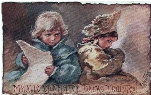
Милые бранятся, только тешутся!