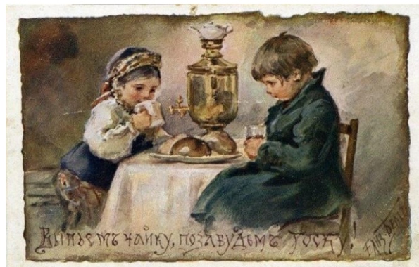
Выпьем чайку, позабудем тоску!