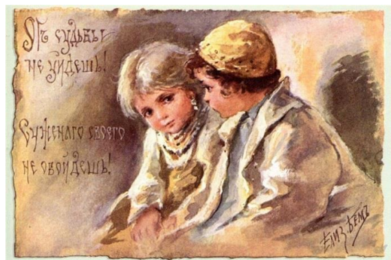
От судьбы не уйдешь, суженого своего не обойдешь!