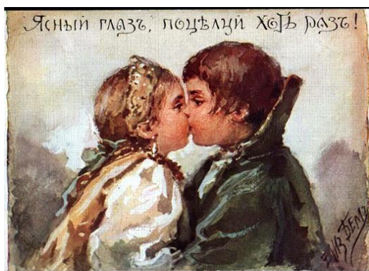
Ясный глаз, поцелуй хоть раз!