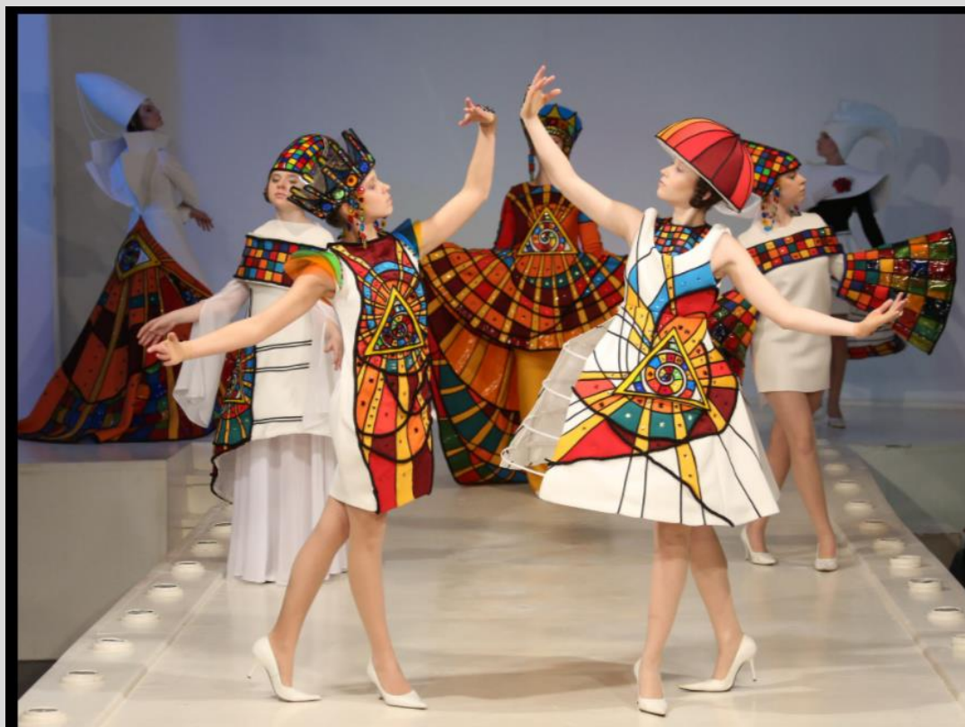
Рисунок 5. XXII Национальный конкурс детских театров моды

ККР НПС реализуется в частности институтами организации творческих коллективов