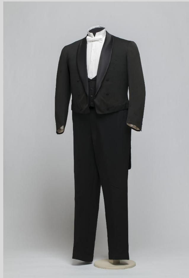
Рисунок 4. Костюм визитный: брюки. Страна Россия, Санкт-Петербург, конец 1880-х – начало 1890-х гг. Эрмитаж, Санкт-Петербург

ККР КЭС реализуется институтами общения (в частности делового человека)