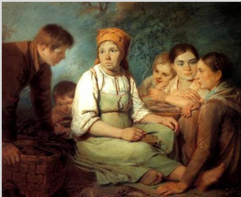
Рисунок 3. Венецианов А. Очищение свеклы, Русский музей.

Костюмология семьи и быта имеет свою специфику. Обычно именно эта сторона вопроса рассматривается в классической костюмологии. Сегодня бытовой костюм отличается (разительно) от того, что было ещё сто лет назад.