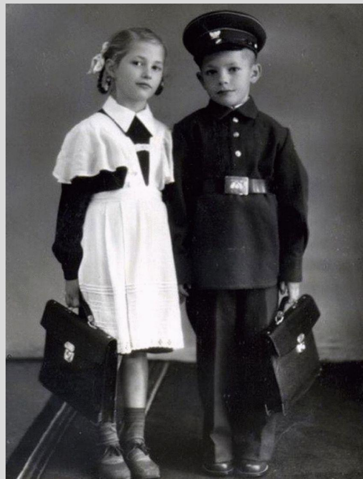
Рисунок 6. Школьная форма СССР

Даже школьная форма изменяется от эпохи к эпохе