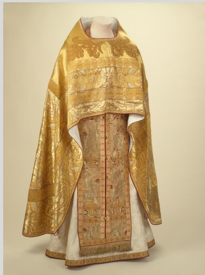
Рисунок 11. Облачение священника: фелонь, Россия, нач. XX в., Эрмитаж, Санкт- Петербург

ККР ДВС реализуется в частности институтами религии