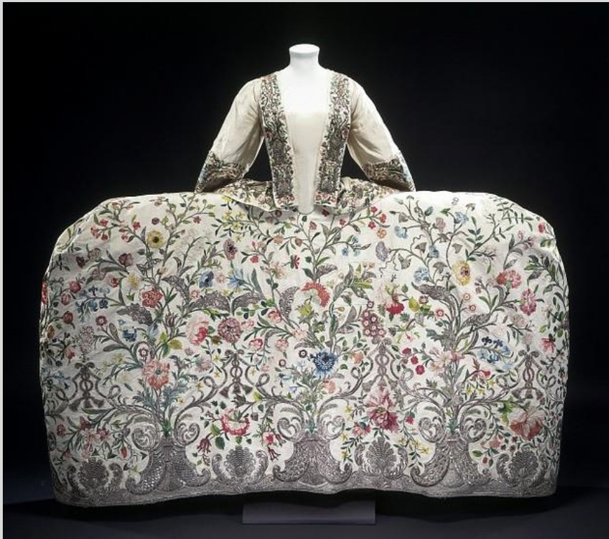
Рисунок 7. Платье XVIII века. Музей Виктории и Альберта,

Это сфера жизни человека (личности, персоны и т. д.), связанная с функционированием той или иной отрасли народного хозяйства, в которых производятся и доставляются потребителям материальные и нематериальные блага и услуги. В настоящее время производственно-маркетинговая сфера связана с ИНДУСТРИЕЙ МОДЫ И КРАСОТЫ