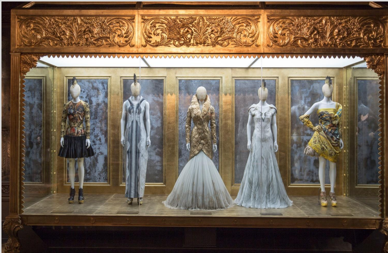
Музей Виктории и Альберта. Лондон, Англия

Эта ситуация несёт в себе ряд противоречий и в конечном итоге влияет на адаптационные характеристики персоны и его окружения.