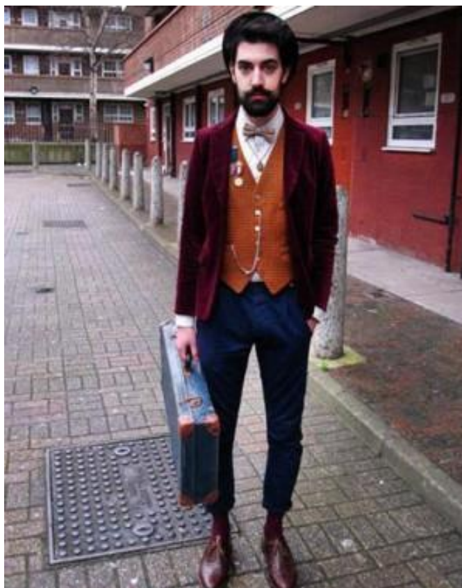
Рисунок 7. Субкультура хипстеров

Модная формула хипстера – диффузия, он может смешивать винтажные вещи с модными брендовыми. Во многих статьях, разбирающих стиль хипстеров, чаще всего мы можем встретить следующее описание: зауженные брюки, свитер из бабушкиного сундука, снуд, очки в пластиковой оправе, лоферы и старый пленочный фотоаппарат на шее (рис. 7, 8) [13]. Не является ли противоречащим тот факт, что образ хипстера настолько предсказуем, как и все массовое. В виду вышеперечисленного назревает вопрос о причастности хипстеров к молодежным субкультурам. Субкультуры, как правило, противостоят массовой культуре, имеют идеи и ценности, отличные от общественных, так можно сделать вывод, что хипстеры находятся на границе массовой культуры с субкультурой.