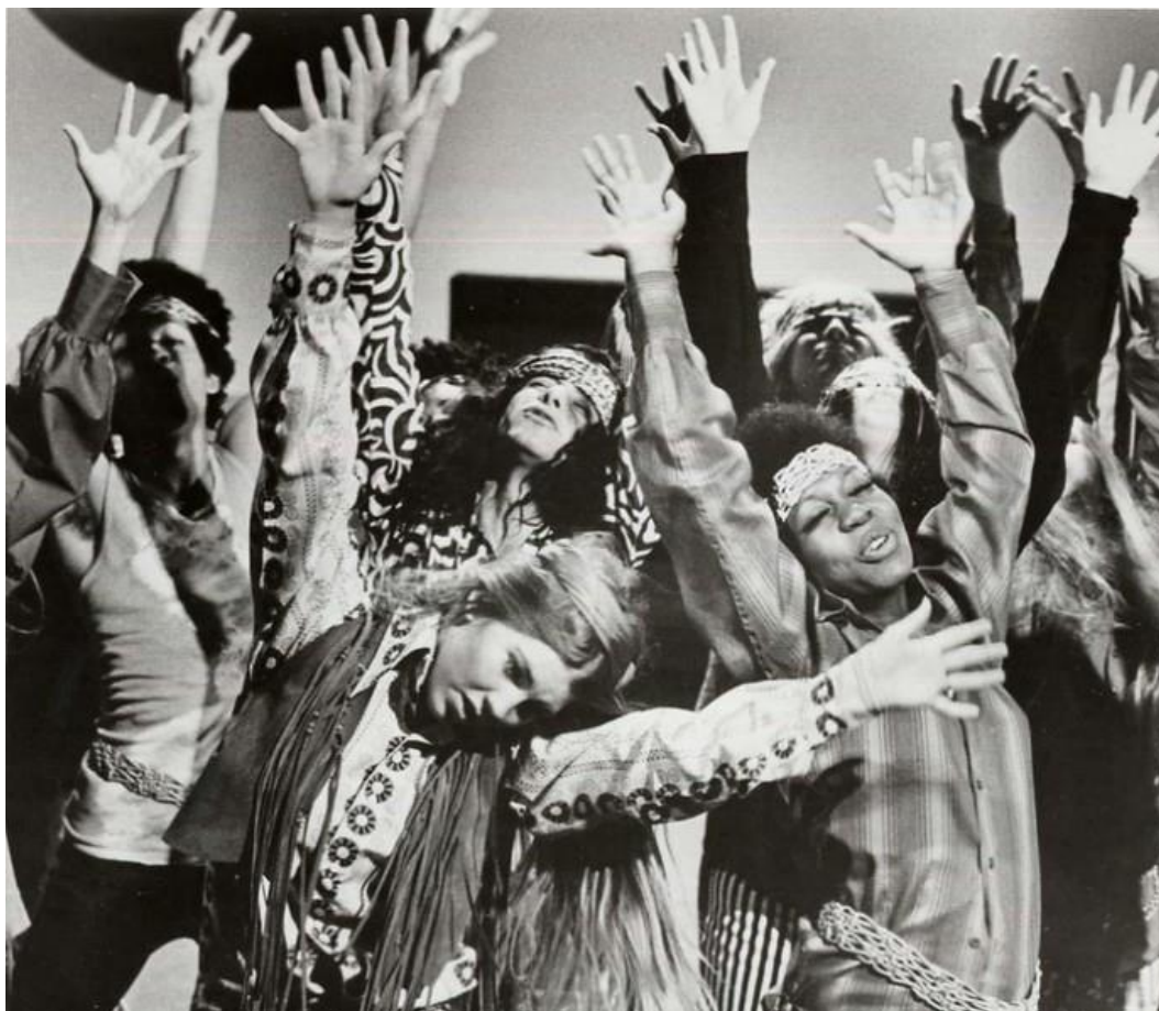
Рисунок 2. Субкультура хиппи

и скрываются за масками бунтарей, выражая полное отрицание и потерю надежды к существенным изменениям в политике, общественных ценностях и жизни в целом [11]. Но панки своим бунтарским духом показывают свои истинные намерения и смелость в принятии решений, хоть и, высказывая это агрессивно, как правило, такая провокация по нужным каналам быстрее доходит до адресата.