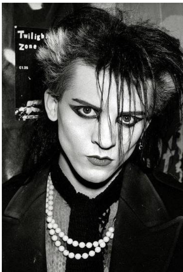
Рисунок 6. Субкультура готов

В субкультуре готов есть несколько подстилей, которые отличаются друг от друга, прежде всего, во внешнем виде. Например, «викторианские готы» предпочитают одежду в стиле XIX века, кибер-готы с добавлением к черному ярких кислотных цветов или готический стиль, граничащий с вампиризмом [7]. Готы, в отличие от других субкультур, в большинстве своем, образованны, высокоинтеллектуальны и стремятся к саморазвитию, интересуются искусством и литературой. Некоторые исследователи, наоборот, проводят параллель между готической субкультурой, депрессией и суицидальными наклонностями, но этот факт статистически не доказан. С другой стороны, невозможно отрицать интерес готов к теме смерти, но смерть готов притягивает с точки зрения мистицизма, граничит с меланхолией и печальной созерцательностью [7]. Готы могут верить в загробную жизнь, интересоваться оккультизмом, именно поэтому они выбирают отдаленные обособленные места и развалины, где философствуют на темы выхода за границы реальности и обыденности. Субкультура готов в настоящее время не теряет своей актуальности, по всему миру проходят мероприятия и фестивали, посвященные, в первую очередь, готической музыке. А известные дизайнеры со всего мира создавали и продолжают создавать коллекции, вдохновленные стилем этой субкультуры.