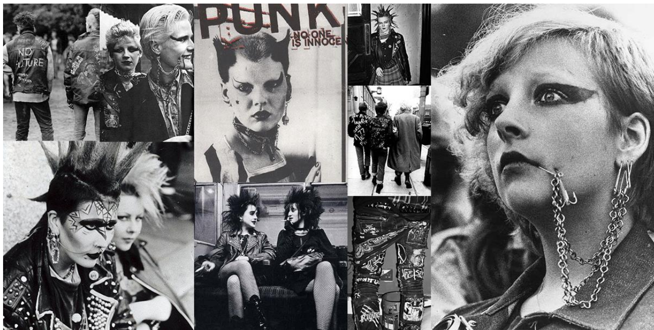
Рисунок 3. Субкультура панков

прически. Движение субкультуры панков тесно взаимодействует с творчеством дизайнера Вивьен Вэствуд, а образ панка, зарождающийся в противовес моде, трансформировался в модный образ и освещался в фотосессиях и статьях на страницах модных журналов. Так и сейчас можно сказать, что стилистические особенности субкультуры панков можно увидеть в коллекциях современных дизайнеров, но скорее, как переработанный – пост-панк [11] (рис. 3, 4).