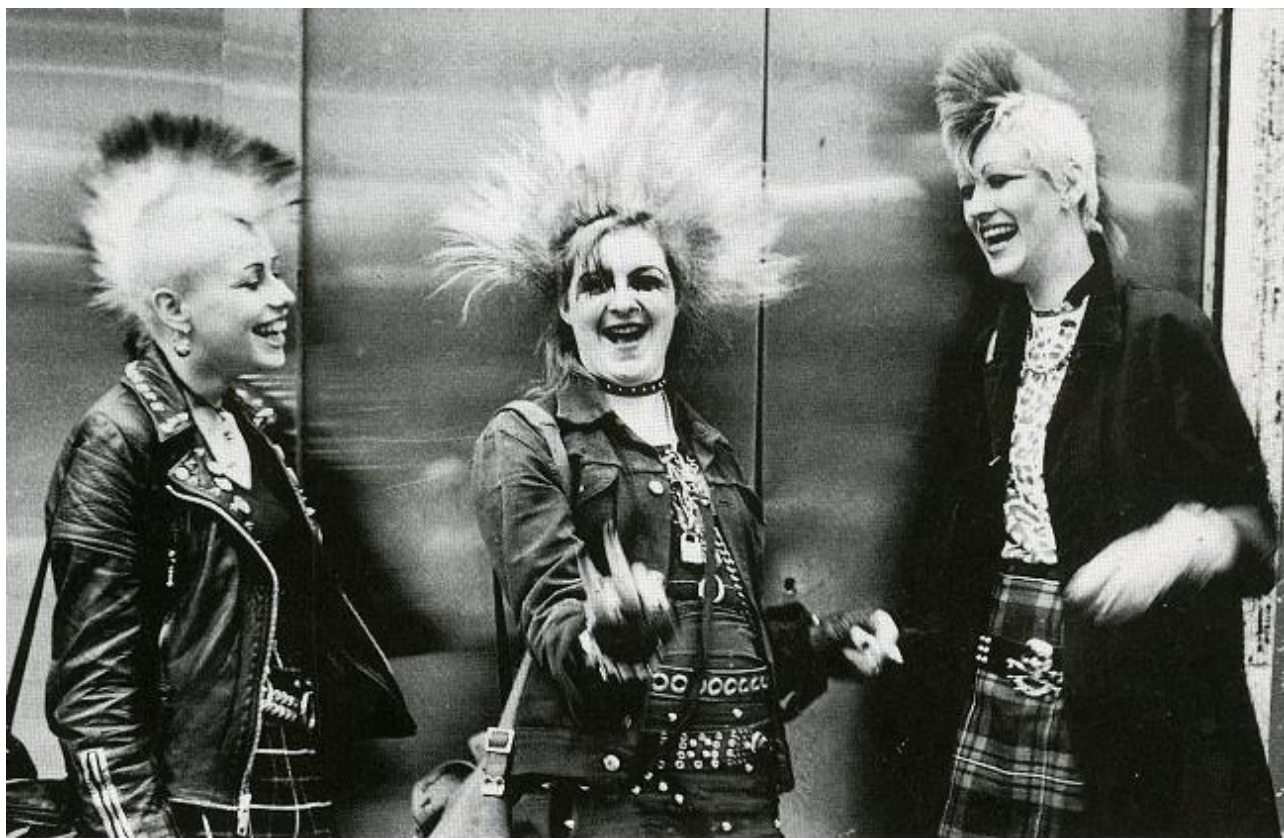
Рисунок 4. Субкультура панков