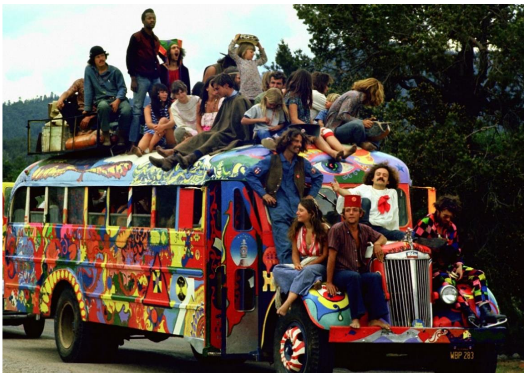
Рисунок 1. Субкультура хиппи

Влияние культуры хиппи на музыку, кино и живопись неоспоримо – психоделическая яркая живопись проявлялась не только в одежде, аксессуарах, но и предметах быта; музыкальные композиции таких групп, как «The Beatles», «Jefferson Airplane» и др. были музыкальными иконами; а немного позднее появились фильмы, посвященные этой субкультуре [9] (рис. 1, 2).