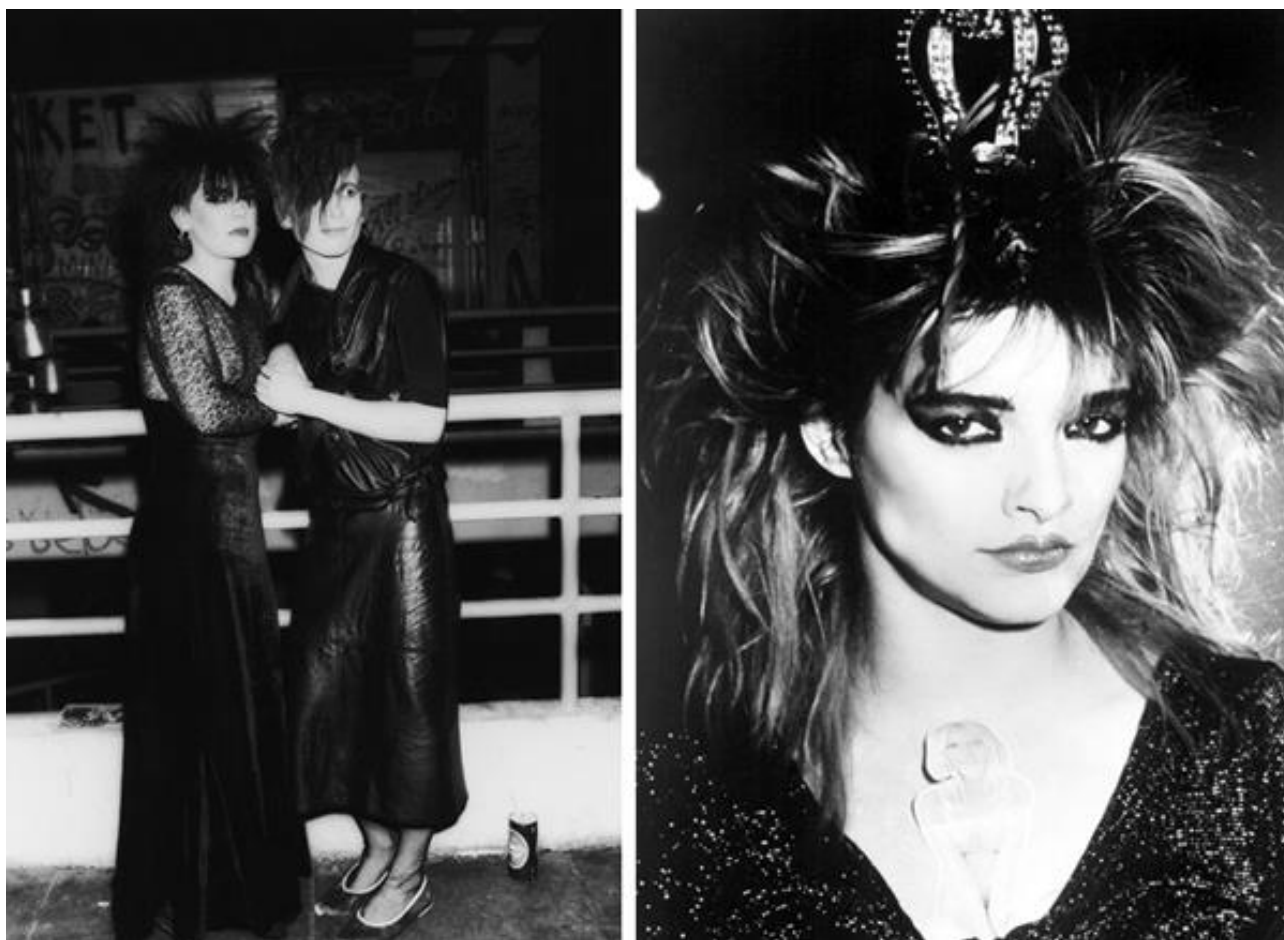
Рисунок 5. Субкультура готы

Готическая мода, прежде всего, появилась благодаря имиджу музыкантов и исполнителей готического рока, на которых, в свою очередь, оказывали влияние литература и кино (фильмы в жанре ужасов или в стиле нео-нуар), а это преимущественно черный цвет или очень темные оттенки других цветов, мрачный макияж и соответствующая прическа. Неотъемлемыми атрибутами являются и аксессуары с определенной символикой: кресты, черепа, пентаграммы, «анх» как символ бессмертия, также изображениями летучих мышей, драконов и др. Изначально, многие атрибуты панков заимствованы готами, к таковым можно отнести пирсинг, цепи, шипы, ирокезы или растрепанные прически. Что касается макияжа, то он абсолютно независим от гендерных различий: и парни, и девушки подводят глаза, красят губы и ногти, а также намеренно выбеливают кожу лица (рис. 5, 6).