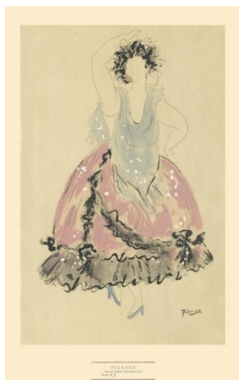
Рисунок 2. П. Пикассо Костюм жены мельника. Раскраска по трафарету, 26*19 см. Лондон 1919

Принцип контрастности стал для Пикассо главным образным ходом, который был отражен не только в костюме, но и в декорациях, занавесе, музыке, танце. Это тот концептуальный подход, который раскрыл визуально испанский колорит.