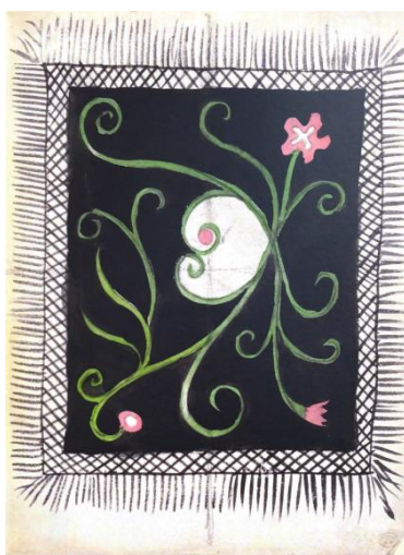
Рисунок 1. П. Пикассо Эскиз платка жены мельника. Раскраска по трафарету, 26*19 см. Лондон 1919

Издание содержит 32 пошуара (раскраска гуашью трафарета) с театральными костюмами и сценографией [4]. В основу изображений легли даже мелкие детали, которые стали важным и значимым дополнением постановки. Одним их таким дополнений стал эскиз платка главной героини — элемент, который в своем простом и лаконичном образе отразил суть и тему всей постановки (рис. 1).