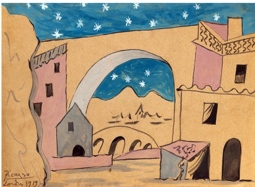
Рисунок 4. П. Пикассо Эскиз декорации к балету «Треуголка». Лондон 1919. Рисунок

Так принцип контрастов, отраженный в музыке и костюмах был очень точно подчеркнут в оформлении сцены. Декорации Пикассо выявили дух Испании в образе ее пейзажа, в оранжевых оттенках выжженной солнцем земли, в темно-голубом небе, где, мерцая, зависали семь сияющих звезд. На таком контрастном фоне исполняли свои очень динамичные и ритмичные танцы персонажи в ярких и контрастных костюмах. Такое решение должно было родить хаос и визуальный шум на сцене. Но художник применил свое мастерство подчинять любой элемент системе и рождал органичный, живой и ясный образ. Постановка стала ярким и пестрым действием, имеющим испанский колорит и четко считающийся механизм взаимодействия цветов, ритмов, движений и форм.