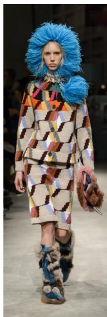
1в. Коллекция Prada