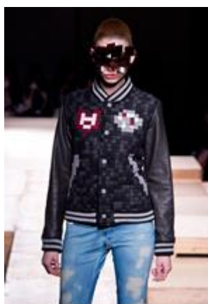
Рисунок 5. Модель из коллекции бренда Anrealage ( http://www.kawaiianpunch.com/2012_07_01_archive.html )