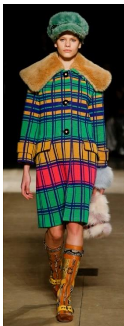
1б. Коллекция MiuMiu