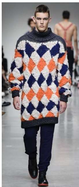
1а. Коллекция Sibling

Во-вторых , преобладает контрастная, построенная на сочных, чистых цветах, с преобладанием ярких красных оттенков цветовая гамма. Подобная броскость диктует свои условия, именно поэтому в коллекциях превалирует симметрия (рис. 1).