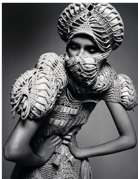
Рисунок 2. Трикотажный костюм из коллекции Сандры Бекланд

В-четвертых, следует заметить, что в ассортиментной группе прослеживается идея совмещения спортивной и классической одежды за счет резкой палитры цветов и подачи образа (рис. 3). Трикотаж всегда ассоциировался со спортивной одеждой, и такая ассоциация только играет на руку модельерам в этом году.