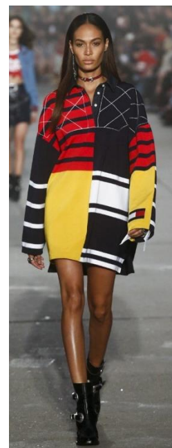
1г. Коллекция Tommy Hilfiger