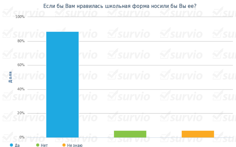
Рисунок 3. Результаты ответов на вопрос: «Если бы вам нравилась школьная форма, носили бы Вы ее?»

В тоже время ответ на вопрос 6: Если бы вам нравилась школьная форма, носили бы Вы ее? , – расставляет все по своим местам: 96 % респондентов ответили положительно (рисунок 3).