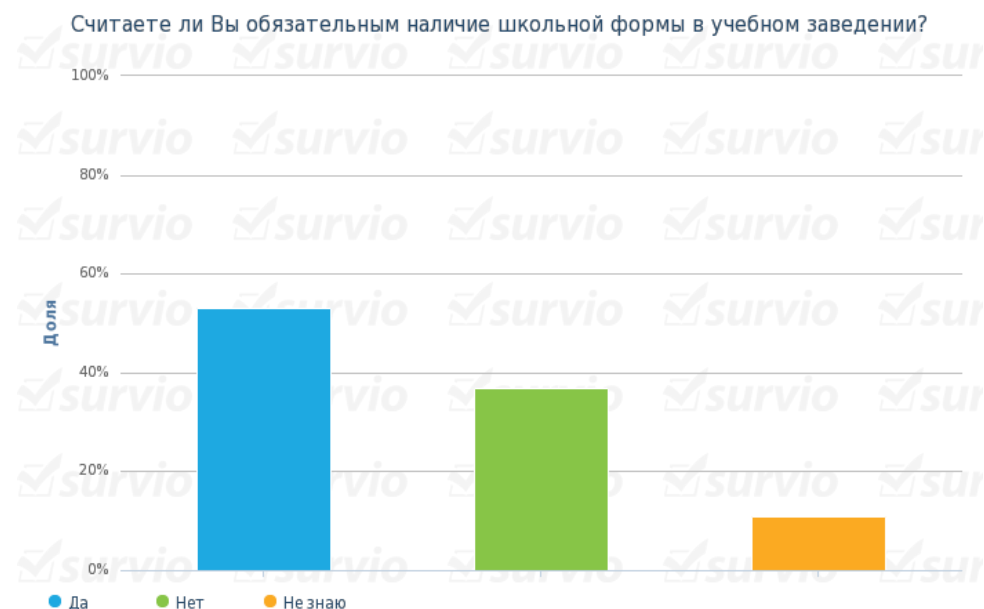
Рисунок 2. Результаты ответов на вопрос анкеты: «Считаете ли Вы обязательным наличие школьной формы в учебном заведении?»

Отвечая на 5 вопрос: «Считаете ли Вы обязательным наличие школьной формы в учебном заведении?» – респонденты высказались следующим образом: 53 % за и 37 % против, что характеризует полярное мнение обучающихся по отношению к данному вопросу (рисунок 2).