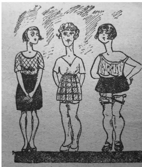
Рисунок 2. Карикатура, высмеивающая моду на короткие юбки 9

Накрашенную, напудренную и раздетую девушку часто уподобляли дикарке или цыганке, некультурному, ленивому и необразованному созданию: «В 36-й ячейке есть группа девчат, которые обильно употребляют продукцию “ТЭЖЭ” [Трест жировой промышленности Москвы – И.С.], обвивают шеи бусами, нанизывают на уши чуть не фунтовые серьги. Спрашивается, зачем и для чего? Они и сами не знают. Девчата, употребляющие краску и украшения, самые отсталые в нашей ячейке. Ничем они не интересуются, кроме танцев и разговоров о “нем”, стараются всеми правдами и неправдами сбежать с собраний, не желают работать». 10