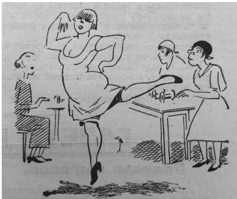
Рисунок 1. Карикатура «Мещаночка» 3

Особенно активно в этот период обсуждалась мода на короткие юбки: «Где как соревнуются, а в отделе фабрикатов конторщицы устроили негласное соревнование на самую короткую юбку. Приза еще никем не получено, так как предел коротчайшей юбки пока не достигнут.