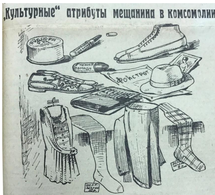
Рисунок 4. Такие предметы гардероба – символы мещанства 14

Так же, как борьба с пьянством была связана не только с искренней заботой власти о здоровье рабочих, но и с желанием снизить количество «пьяных» прогулов, брака, трат на спиртное, борьба с дорогой одеждой и косметикой велась из-за финансовых потерь, которые они приносили [12, с. 18-33; 13, с. 24-25]. После маникюра, покупки косметики, чулок и платья у простой работницы с низким жалованием могло буквально не остаться денег на еду [10, с. 50-51], а власть явно не была заинтересована в том, чтобы у станка стояла ослабленная недоеданием женщина.