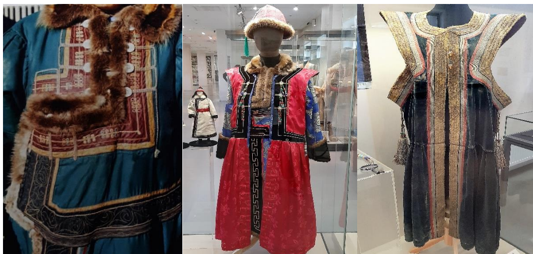
Рисунок 3. Изобразительный вид орнамента в алтайском национальном costume

Традиционной одеждой алтайцев южных племен являлись штаны, рубашки, куртки из хлопчатобумажных тканей, сукна, замши. Геометрические мотивы представлены в орнаменте костюма в различных комбинациях. Орнамент костюмов алтай-кижи состоит как из прямолинейных, так и из криволинейных мотивов. В число прямолинейных (более простых по форме) узоров входят горизонтальные линии, полосы, шевроны, дуги и полукруги, зигзаг,