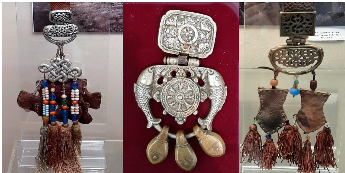
Рисунок 6. Подвеска Бельдууш. Экспонаты из фондов Национального музея республики Алтай им. А.В. Анохина

ребенка. Для пуповины девочки шили мешочки треугольной или ромбовидной формы. Треугольность говорит о том, что предназначение девочки – стать в будущем хранительницей огня. Ромбовидная или прямоугольная форма – форма игольницы. Пуповины мальчиков зашивались в мешочки в форме пороховницы или тажуура [14, с. 130].