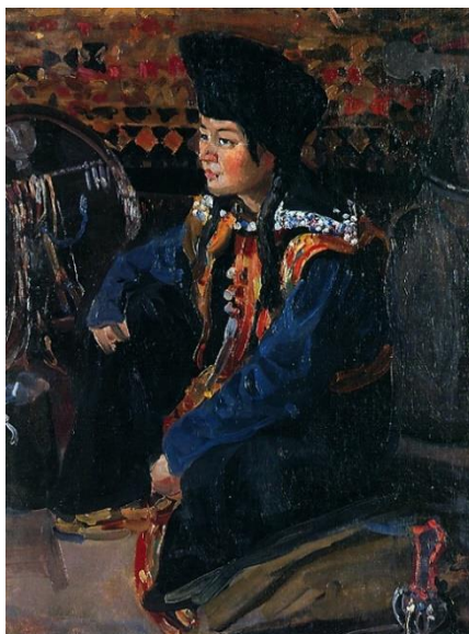
Рисунок 4. «Алтайка в чегедеке» Г.И. Чорос-Гуркин

треугольники (простые и заштрихованные), вписанные треугольники, ромбы, прямоугольники и квадраты, зубцы, сетка, диагонально пересеченные прямоугольники, меандр, Г-образные фигуры, кресты и близкие к ним узоры. К криволинейным относятся простая и S-видная спираль, парноспиральные фигуры, среди них характерная для алтайцев «кульдя» (соединение ромба с парной спиралью) [13, с. 30]. Наиболее устойчивую группу составляют геометрические изображения типа «крест» (саркай), «гусь» (кас), «гребень» (тарак), «корыто» (тоскуур).