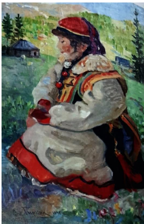
Рисунок 2. «Келин» Г.И. Чорос-Гуркин

Поверх рубашки надевали кафтаны до колен, украшенные широким цветным воротником и пуговицами [9, с. 25]. Традиционной мужской одеждой мужчин северных племен являлась холщовая рубаха без воротника (куннек) и холщовые штаны (шалмар). Поверх нее носили холщовый халат (кендрек) или короткий кафтан с шалевым воротником (чекпен). Зимней одеждой северных алтайцев являлось стеганое пальто из войлока, которое