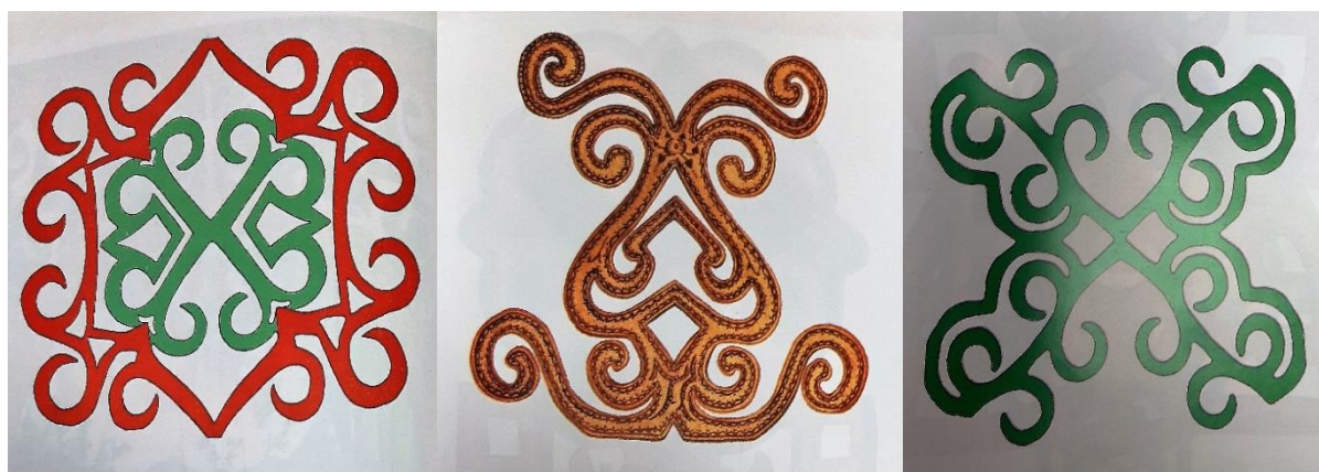
Рисунок 8. Зооморфные орнаментальные мотивы. Рисунки М.Бабакова. Материалы фондов Национального музея республики Алтай им. А.В. Анохина

В изделиях декоративно-прикладного искусства и декоре одежды проявлялись анималистические образы, для которых была характерна замкнутость линий фигуры в несколько конфигураций. Основные иконы, определявшие звериный стиль по формальному перечислению элементов: травоядные млекопитающие местной фауны, олицетворявшие светлую сторону жизни; хищники, олицетворявшие борьбу и дуализм природы; фантастические существа, олицетворявшие потусторонние силы, фигуры и маски, живших в срединном мире людей (отдельные силуэты, всадники, маски ликов, группы людей); птицы как определявшие верх – воздух; рыбы как определявшие низ – воду [1, с. 76]. Зооморфные символы несли определенную смысловую нагрузку, зачастую подчеркивая характер, присущий определенному животному, наделяемому сверхъестественными способностями как позитивного, так и негативного свойства.