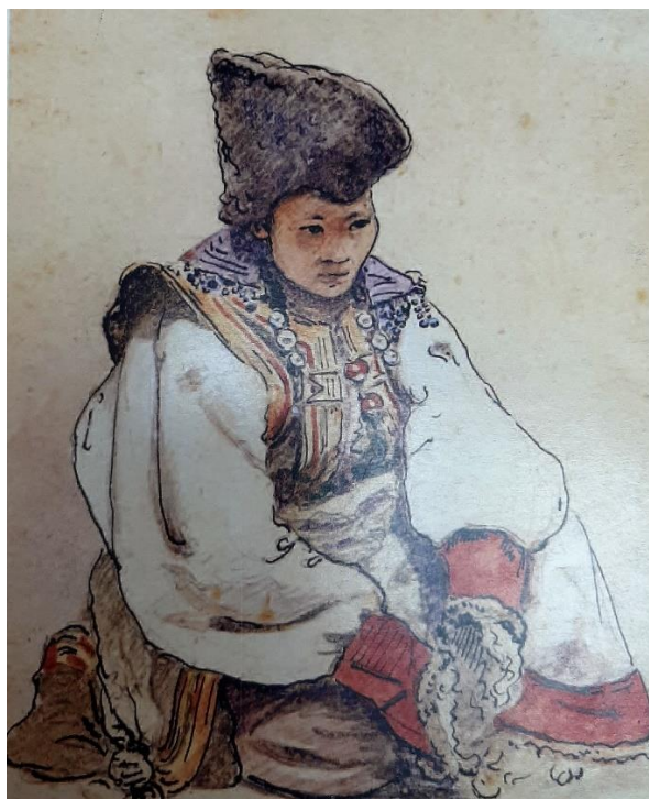
Рисунок 1. «Теленгитка» Г.И. Чорос-Гуркин

холста с широкой оборкой на подоле и с воротником, обшитым бисером, встречается в работах исследователей, изучавших алтайскую культуру в середине 19 в.