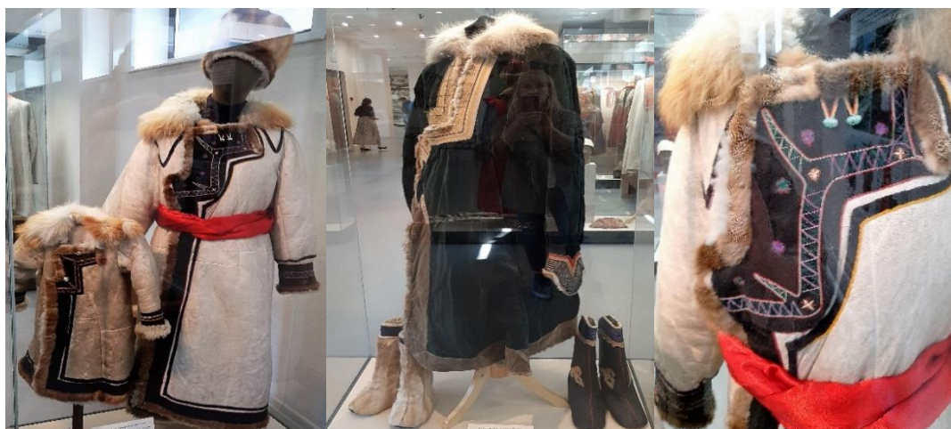
Рисунок 7. Алтайские шубы. Экспонаты из фондов Национального музея республики Алтай им. А.В. Анохина

В изделиях декоративно-прикладного искусства и декоре одежды проявлялись анималистические образы, для которых была характерна замкнутость линий фигуры в несколько конфигураций. Основные иконы, определявшие звериный стиль по формальному перечислению элементов: травоядные млекопитающие местной фауны, олицетворявшие светлую сторону жизни; хищники, олицетворявшие борьбу и дуализм природы; фантастические существа, олицетворявшие потусторонние силы, фигуры и маски, живших в срединном мире людей (отдельные силуэты, всадники, маски ликов, группы людей); птицы как определявшие верх – воздух; рыбы как определявшие низ – воду [1, с. 76]. Зооморфные символы несли определенную смысловую нагрузку, зачастую подчеркивая характер, присущий определенному животному, наделяемому сверхъестественными способностями как позитивного, так и негативного свойства.