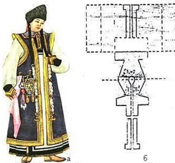
Рисунок 5. Схема кроя чегедека

Обязательной одеждой замужней женщины являлся чегедек – своеобразная безрукавная распашная одежда, отрезная ниже талии, с обязательным разрезом сзади. Края проймы, полы и ворот чегедека обшивали парчой и цветными шелковыми нитками, расположенными в соответствии с цветами радуги. По алтайским поверьям Умай-эне – дух-покровитель материнства спускается на землю по радужному мосту. В комплекте с островерхой шапкой «Кураан борук» силуэт женщины напоминает священную для алтайцев трехглавую вершину «Уч Сумер». Важным элементом чегедека считалось украшение «бельдууш» – металлическая подвеска, которую носили на левом боку и на которую навешивали кисет, огниво, игольницу и мешочки с пуповинами детей. Фасоны мешочков для пуповин кроились в зависимости от пола