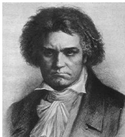
Рисунок 4. Людвиг Михалеk (Ludwig Michalek). Людвиг Ван Бетховен, ок. 1900 г., частная коллекция

Одним из ярких стилевых направлений в искусстве 2-й половины XX века, не теряющим актуальность и в настоящее время, является поп-арт. Образы и предметы, материальные ценности общества потребления составляют в нём основу для творчества. Произведения, выполненные в стиле поп-арт, в свою очередь, вдохновляют дизайнеров костюма, которые охотно используют яркие портреты искусства, порождённого массовой культурой. Среди наиболее прославленных представителей поп-арта следует выделить Энди Уорхола (Andy Warhol). Многие «портреты созданы по фотографиям, которые Уорхол снимал и перерабатывал сам. Затем оригиналы были сильно увеличены, методом шелкографии перенесены на холсты с грунтом разного цвета и помещены рядом друг с другом или друг на друге» [7, с. 260].