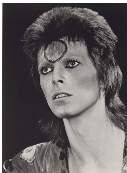
Рисунок 8. Mick Rock. Ziggy Stardust (David Bowie). 1973, Morrison Hotel Gallery

В настоящее время, пожалуй, одной из самых востребованных форм портрета можно назвать фотографию. «Уже в течение первого года после того, как Луи Дагер (1787–1851) сделал знаменитый снимок парижского бульвара, начали появляться фотографические портреты» [9, с. 15]. С развитием современных технологий фотоискусство, зародившееся ещё в XIX веке, стало доступно огромной массе людей. Любители, наряду с профессионалами, предлагают разнообразные творческие решения в области фотографии, используют классические приёмы съёмки и актуальные новейшие находки цифровой техники. Для одного художника фотография сама по себе является конечным результатом творческого процесса, для другого же становится лишь отправной точкой, основой для создания оригинального произведения искусства. Фотопортреты являются практически неотъемлемой частью модных коллекций. На их основе создаются принты и набивки, количество и качество которых зависит от индивидуальной задумки дизайнера и несколько ограничено требованиями модных тенденций.