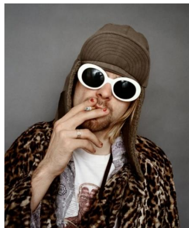
Рисунок 10. Kurt Cobain, Nirvana, by Jesse Frohman, 1993, Morrison Hotel Gallery

Еще одним примером привлечения фотопортретов для создания выразительных композиций в костюме является коллекция Undercover осень–зима 2016/17 (рис. 11). В моделях использованы работы современного немецкого художника-коллажиста Мэттью Бурела (Matthieu Bourel), превращающего винтажные фотографии в сложные сюрреалистические изображения, разбирая лица на детали, складывая из них мозаики и создавая размноженные маски. На основе фотоколлажей из серии «Duplicity» (рис. 12) были разработаны орнаментальные мотивы для дальнейшего воспроизведения в комплектах одежды. «Орнамент ткани как один из элементов композиции костюма, должен быть согласован с его формой» [10]. При разработке изображения необходимо учитывать его соразмерность масштабу человека, а также характер силуэта. Так, в одной из подиумных моделей укрупнённое изображение легло в основу купонного рисунка широких брюк, а монокомпозиция, расположенная на трикотажном джемпере, повторяет коллаж Бурела в более мелком масштабе, занимая центральное положение на груди.