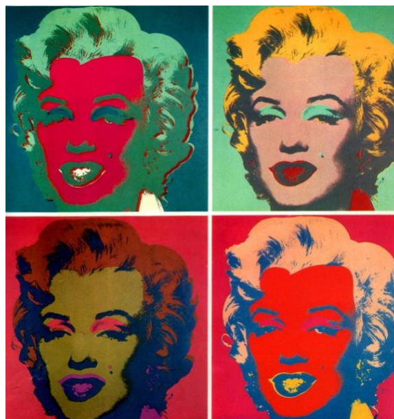
Рисунок 6. Энди Уорхол. Мэрилин Монро. 1967 г., частная коллекция

Креативный директор бренда Undercover Джун Такахаша (Jun Takahashi) в коллекции женской одежды сезона весна–лето 2019 также сфокусировался на стиле поп-арт и поп-культуре (рис. 7). Модели одежды были созданы в сотрудничестве с фотографом Миком Роком (Mick Rock), который являлся фотохроникером Дэвида Боуи (David Bowie) во времена Ziggy Stardust (рис. 8). Такахаша получил от фотографа разрешение на использование снимков Боуи для создания интарсионной вязки, вышивки, а также принтов, чтобы включить их в модельный ряд. Особого внимания заслуживает модель, одетая в широкие атласные брюки золотисто-песочного оттенка с отворотами и ярко-розовый джемпер over-size. Расположенный по всему переду зеленого цвета с включением люрексной нити портрет Дэвида Боуи, выполненный с помощью технологии вязки интарсия в контрастных цветах и цветовых блоках, напоминает технику работы с портретами звезд Энди Уорхола. «В этих изображениях известных личностей Уорхол возрождает жанр портретной живописи и популяризирует его в типичной поп-артистской манере» [7, с. 260]. Образ модели дополнен креативной прической со сложным окрашиванием в розовый и чёрный цвет и зеленой помадой. В качестве аксессуара – ярко-розовые перчатки, в качестве обуви – блестящие босоножки на высокой платформе.