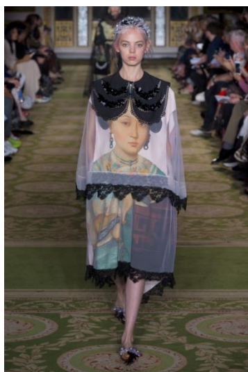
Рисунок 1. Коллекция Simone Rocha весна–лето 2019 2

«Портретная живопись – одна из самых доступных форм искусства и, возможно, наиболее ценимая» [5, с. 10], а примером её использования в дизайне современного костюма может служить коллекция Simone Rocha весна–лето 2019 (рис. 1). Дизайнер бренда Симон Роча (Simone Rocha), имея китайские и ирландские корни, в моделях сезона обратилась к портретам китайских наложниц, как источнику для поиска идей. В нескольких подиумных комплектах в качестве купонной орнаментальной композиции было использовано изображение девушки, выполненное в технике портрета работы Джузеппе Кастильони (Giuseppe Castiglione) (в Китае принял имя Ла Шинин (Lang Shining)) «Ароматная наложница» (2-я половина XVIII века) (рис. 2). Рисунки нанесены практически по всей плоскости шёлковых и хлопковых тканей белого и чёрного цветов платьев, покрытых чёрными и белыми шифоновыми шальями с отделкой кружевом.