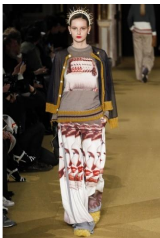
Рисунок 11. Коллекция Undercover осень–зима 2016/17 8

Еще одним примером привлечения фотопортретов для создания выразительных композиций в костюме является коллекция Undercover осень–зима 2016/17 (рис. 11). В моделях использованы работы современного немецкого художника-коллажиста Мэттью Бурела (Matthieu Bourel), превращающего винтажные фотографии в сложные сюрреалистические изображения, разбирая лица на детали, складывая из них мозаики и создавая размноженные маски. На основе фотоколлажей из серии «Duplicity» (рис. 12) были разработаны орнаментальные мотивы для дальнейшего воспроизведения в комплектах одежды. «Орнамент ткани как один из элементов композиции костюма, должен быть согласован с его формой» [10]. При разработке изображения необходимо учитывать его соразмерность масштабу человека, а также характер силуэта. Так, в одной из подиумных моделей укрупнённое изображение легло в основу купонного рисунка широких брюк, а монокомпозиция, расположенная на трикотажном джемпере, повторяет коллаж Бурела в более мелком масштабе, занимая центральное положение на груди.