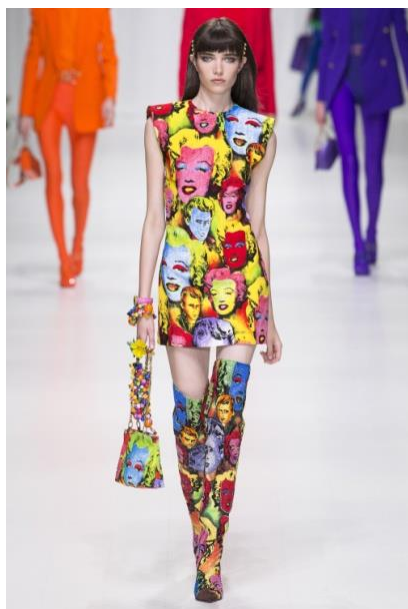
Рисунок 5. Коллекция Versace весна–лето 2018 5

раппортную композицию и перенесены в некоторые комплекты одежды: на блузу и колготки с босоножками, мини-платье без рукавов с плечевыми накладками и сапоги-ботфорты, где рисунок дополнен стразами. Длинное платье на бретелях с фигурной линией декольте, украшенное стразами, и искрящийся комбинезон плотно прилегающего силуэта с длинным рукавом также выполнены из тканей с орнаментальными мотивами в стиле поп-арт. Изображения, в которых использованы «кричащие краски для подчёркивания пестроты и показного блеска, столь характерных для массовой культуры» [8, с. 5], полностью соответствуют образному решению модели, стилевому направлению и назначению костюма, что является необходимым условием для достижения гармонии в костюме.