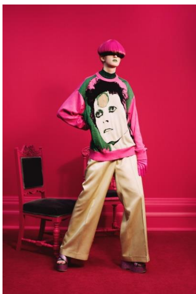
Рисунок 7. Коллекция Undercover весна–лето 2019 6