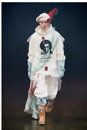
Рисунок 3. Коллекция мужской одежды Undercover осень–зима 2019/20 4

осень–зима 2019/20 (рис. 3). «Эстетика бренда представляет собой анархическое столкновение насилия (разрезанные, разорванные и перешитые ткани) и поэзии (шифон, кружево и выцветшие цветочные принты)» [7, с. 268], что полностью отражено в подиумных моделях, созданных под вдохновением романом Энтони Бёрджесса «Заводной апельсин» (Anthony Burgess, «A Clockwork Orange», 1962 г.) и одноимённым фильмом, снятым в 1971 году режиссёром Стэнли Кубриком (Stanley Kubrick). Образ Бетховена (рис. 4) появляется в нескольких комплектах, один из которых представляет собой костюм из искусственного меха молочного цвета с капюшоном, трикотажный джемпер с воротником «turtle neck»; поверх костюма надета прозрачная непромокаемая накидка без рукавов с капюшоном. В качестве аксессуаров – коричневые резиновые сапоги, высокие кожаные перчатки мятного цвета, кольцо с крупными подвесами, а также вязаный берет молочного цвета, украшенный искусственной розой и страусовыми перьями. Портрет композитора занимает центральное положение в композиции костюма в виде принта.