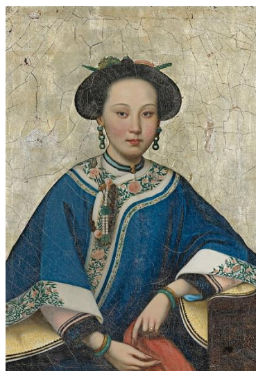
Рисунок 2. Джузеппе Кастильони. Ароматная наложница , 2-я половина XVIII века, Дворцовый музей, Пекин, КНР 3

Графический портрет величайшего композитора Людвиг ван Бетховена (Ludwig van Beethoven, 1770–1827 гг.) был использован в коллекции мужской одежды Undercover