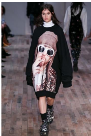
Рисунок 9. Коллекция R13 осень–зима 2017/18 7