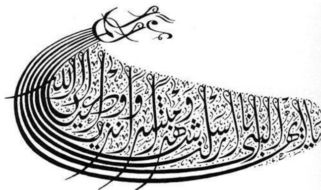
Рисунок 6. Арабский эпиграфический орнамент 2

• Эпиграфические — это орнаменты представляющие собой стилизованные надписи, состоящие из букв и слов. Данный вид национального кода развит в странах Азии и странах исповедующие ислам. На рисунке 6 представлен пример арабского орнамента, используемый для украшения архитектурных зданий, сооружений, посуды и т. д.