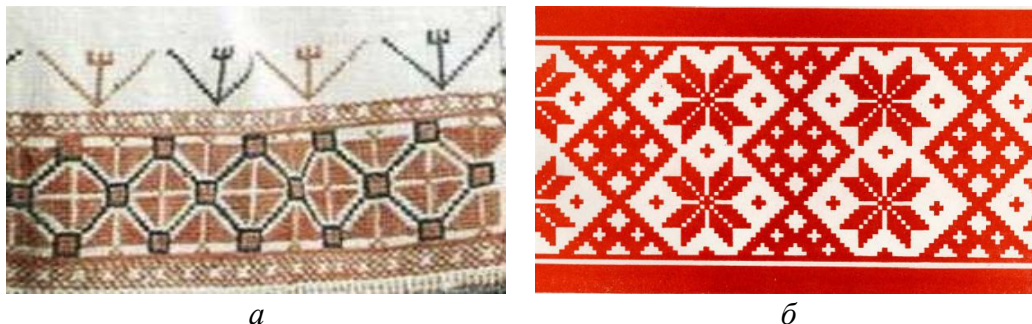
Рисунок 1. Национальные геометрические орнаменты:

• Геометрические — орнаменты построены на чередовании геометрических фигур: круга, квадрата, прямоугольника, ромба, многоугольника, креста. Одними из наиболее узнаваемых геометрических орнаментов среди народов России являются национальные узоры русских, удмуртов и чувашей. На рисунке 1 представлены примеры геометрического орнамента — национальные узоры русских и белорусов.