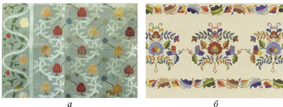
Рисунок 2. Национальные растительные орнаменты:

• Растительные — основой для этих орнаментов являются разнообразные растения и их части: цветы, листья, стебли, плоды ягод и т. д. Растительные узоры были широко распространены среди многих российских народов, ведь их связывали с плодородием, жизнью и гармонией природы. Изображения цветов и стеблей широко используются на национальных узорах башкир, татар, калмыков, осетин и т. д., применяются в хохломских, гжельских, жостовских росписях русского народа. На рисунке 2 представлены национальные растительные узоры русского и татарского народов.