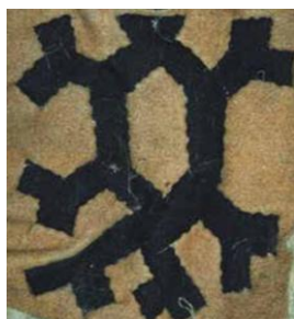
Рисунок 3. Национальный хантыйский зооморфный орнамент: медведь [6]

• Зооморфные — это орнаменты, в которых использованы изображения реальных или фантастических животных, зверей и птиц. Зооморфные орнаменты встречаются в культуре различных северных народов России, отражая почтение животным, охоту и суровый климат. На рисунке 3 представлен хантыйский зооморфный орнамент.