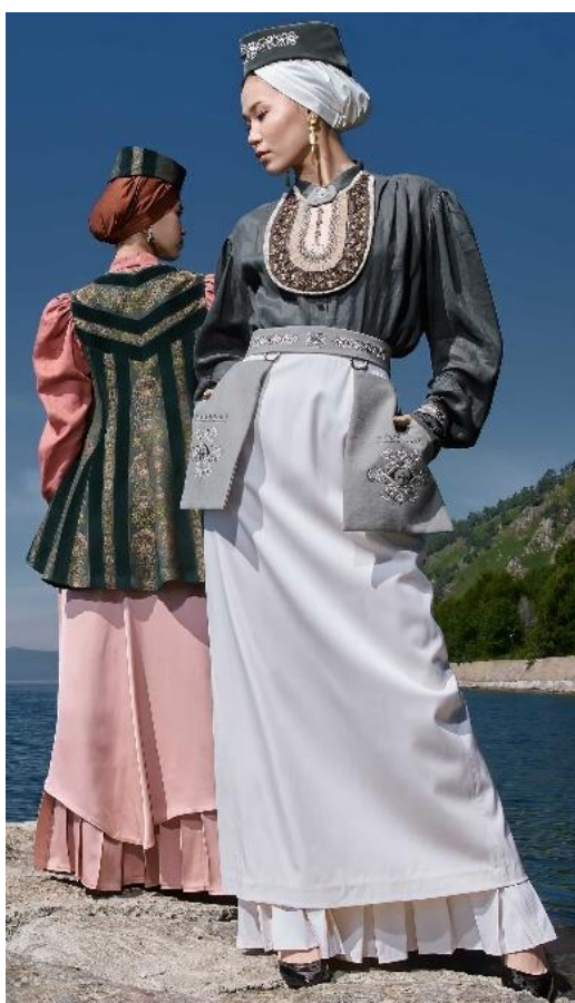
Рисунок 8. Одежда бренда «Buro Banu» 4

Большое внимание в коллекциях «Buro Banu» уделяется отдельным деталям татарского костюма — представлено разнообразие головных уборов, накидок, изю, поясов украшенных татарским орнаментом. Ассортимент бренда «Buro Banu» включает в себя как женские, так и мужские изделия.