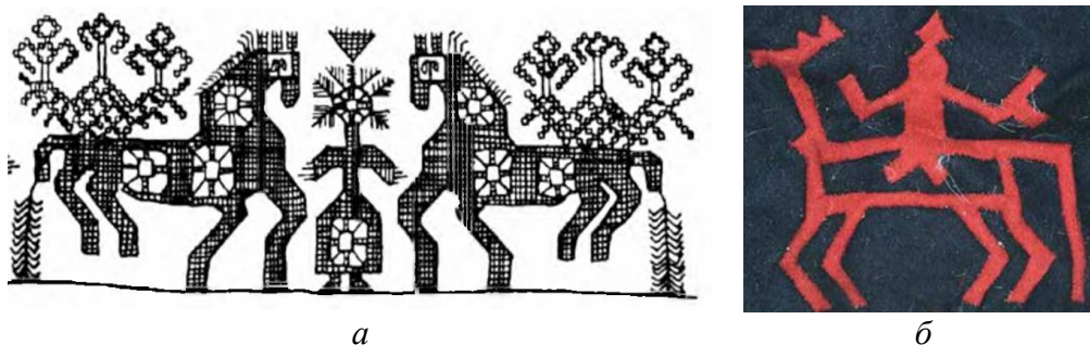
Рисунок 5. Национальные антропозооморфные орнаменты:

а — карельский орнамент [7]; б — хантыйский орнамент: всадник на олене [6]