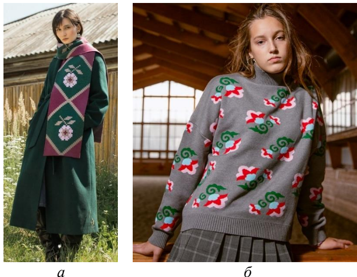
Рисунок 11. Изделия бренда «Idel» 9 : а — шарф женский; б — свитер

В 2019 году был запущен татарский национальный бренд спортивной одежды «ALGA», отличающийся применением традиционных символов региона. Его продукция включает оригинальную вышивку с изображением флага и герба Татарстана. На сегодняшний день бренд успешно взаимодействует с представителями профессионального спорта, государственных органов власти, коммерческих предприятий и ведомств Республики Татарстан. Внешний вид фирменных моделей представлен на торговой площадке компании в ВК Маркете.