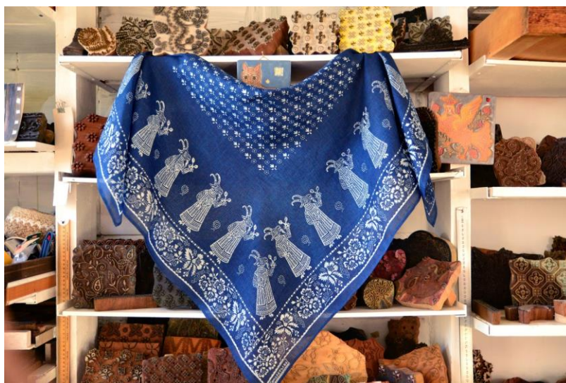
Рисунок 16. Кубовый платок Козы с ручной печатью. Кубовая набойка, ручное крашение, лён-вуаль. 100×100 см. Екатерина Кондратьева. 2022 20