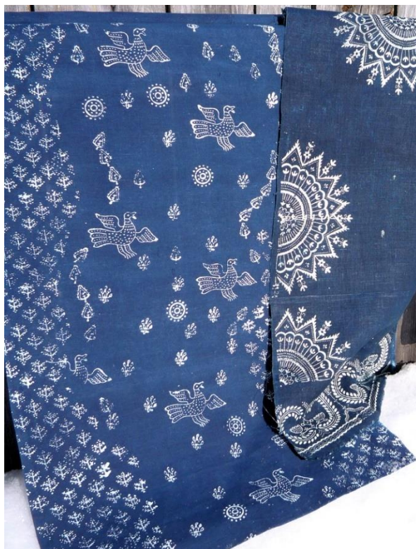
Рисунок 2. Кубовая набойка, 2012 год. Елена Дикова 3

Наиболее интересными являются авторские панно, в традиционный орнамент которых Дикова вводит элементы пейзажа природы Севера. Одной из таких работ является панно, изображающее бурное течение северной реки и берега, поросшие ельником, солнце, склоняющееся к закату, пролетающую над рекой стаю птиц, и сорвавшиеся с ветки осенние листья. Солярные розетки и мотивы птицы решены в их историческом, характерном образе. Мотивы опадающих листьев напечатаны современными штампами и являются современным орнаментальным мотивом, гармонично дополняющим орнаментальные формы XIX века (рис. 2).