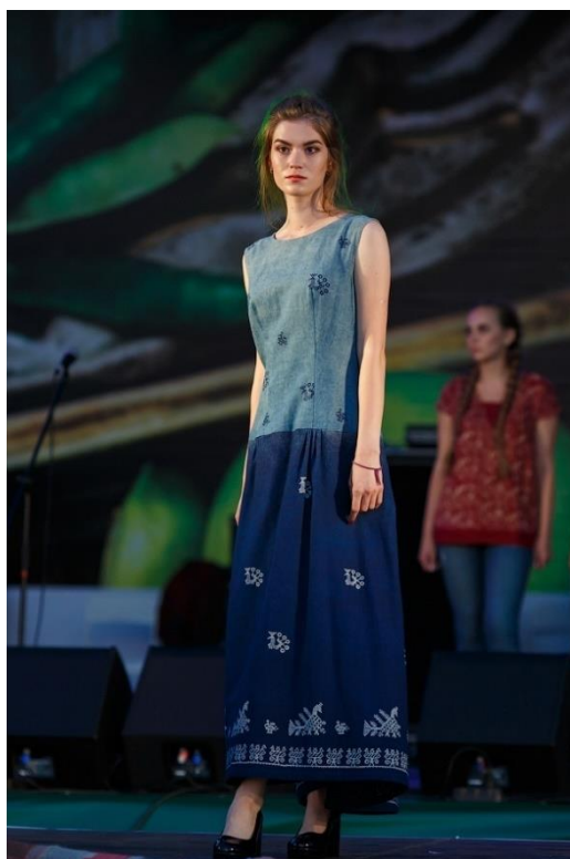
Рисунок 13. Платье из кубовой набойки с мотивом народной вышивки. Фестиваль «Сарафан», Нижний Новгород, 2018 16