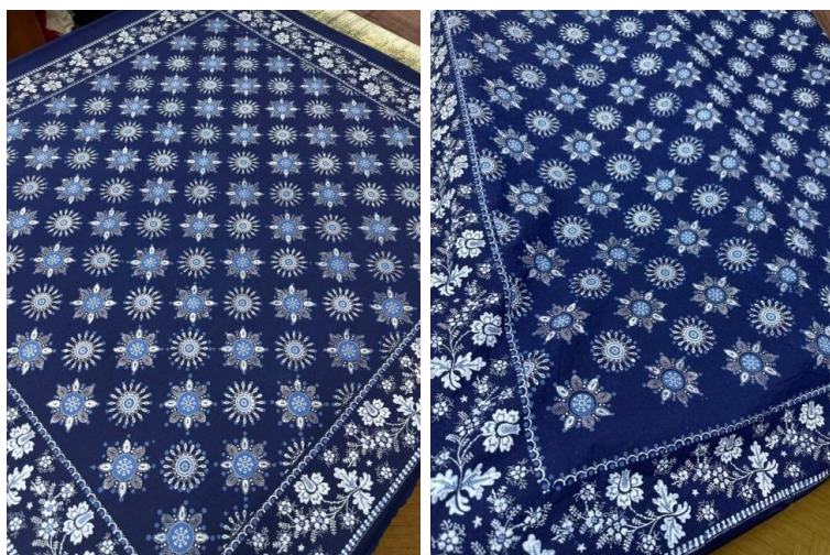
Рисунок 10. Платок хлопчатобумажный Двукубовый от Мастерской Балина (г. Самара), 104×104 см 12