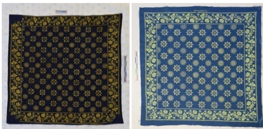
Рисунок 9. Слева — кубовый платок из собрания Музея ивановского ситца, 107×102 см, XIX век; справа — реплика платка работы Павла Осипова 11

Особой гордостью мастерской являются платки двойного крашения, по терминологии Павла Осипова — «двукубовые», представляющие собой изделия с тёмно-синим кубовым полем, украшенные бело-голубым цветочным рисунком. В такой технике изготавливается в мастерской платок, реконструированный Павлом Осиповым для Музея ивановского ситца. Исторический прототип платка, хранящийся в музее, имеет синий кубовый фон и жёлтый орнамент, окрашенный хромпиком (рис. 9). В печатных платках с этим рисунком, выпускаемых «Мастерской Балина» на продажу, Павел Осипов допускает авторскую интерпретацию орнамента, делая его белым на синем фоне, а в розетках и звёздах средника добавляет голубые элементы узора (рис. 10).