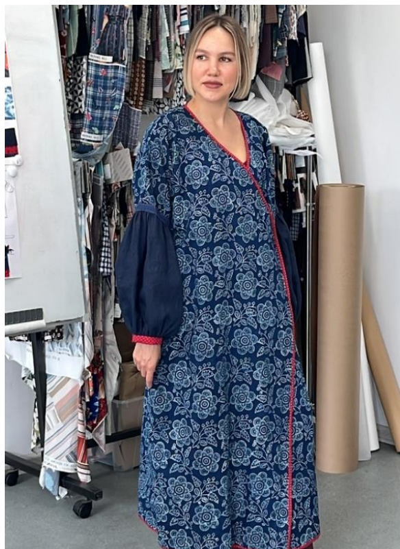
Рисунок 12. Летнее пальто «Запад-Восток», 2024.

Дизайнер — Елена Кныш. Кубовые ткани — Мастерская Балина (г. Самара) 14