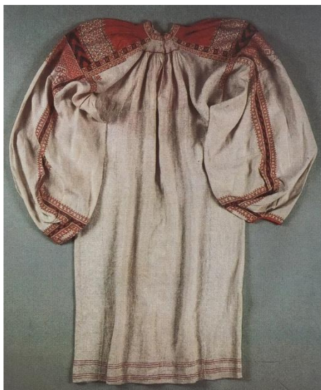
Рисунок 5. Рубаха женская. Середина 19 в.

Особое внимание уделялось оформлению подолов пожнивных и покосных рубах, украшение выглядело в виде широкой полосы с разноцветными узорами.