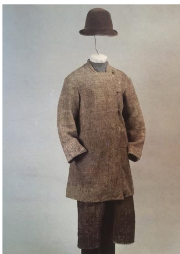
Рисунок 3. Костюм старика будничной. Конец 19 в. – начало 20 в.

Иной комплект женского гардероба составлял сарафан и рубаха. Так же можно отметить, что одежда подчеркивала семейные и возрастные отличия. Например, у юной особы, примерно до пятнадцатилетнего возраста, единственной одеждой являлась рубаха, а одежда мальчиков и девочек до семилетнего возраста была полностью одинаковой и состояла из длинной подпоясанной рубахи, сшитой обычно из старой одежды родителей. Девушки носили косоклинный сарафан, холщовую юбку «подол». У молодых женщин преобладали яркие цвета и набедренная одежда-понева, у пожилых одежда была темного цвета (рис. 2).