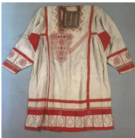
Рисунок 4. Рубаха Мужская. Начало 20 в.

Большое значение имеет головной убор, сильно акцентирующий лицо. В основу всех разновидностей южнорусских головных уборов брался тип «сороки». Этот элемент костюма, был сшит из простого холста, с уплотненной пенькой, а твердая часть берестой. Возвышения на передней части имели отходящие назад рога, и именовалась «кикой» или «рогатой кичкой». Сзади укладывался «позатыльник», который прикрывал волосы на затылке и части шеи, завязывался тесемками вокруг кички под сорокой. «Налобник», «подчелок» закрывал часть лба, виски и кончики ушей.