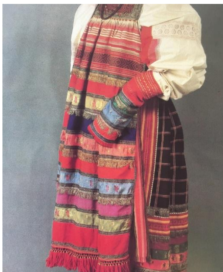
Рисунок 9. Костюм молодой женщины праздничный. Вторая половина 19 в. Курская губ.

Другие южнорусские губернии использовали для вышивки нити черного цвета из шелка или шерсти. Данный орнамент особенно обращал внимания благодаря белому массиву ткани одежды.