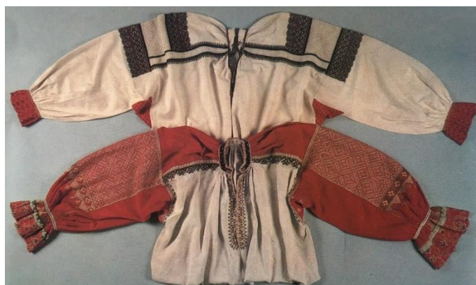
Рисунок 10. Рубахи женские. Конец 19 в.