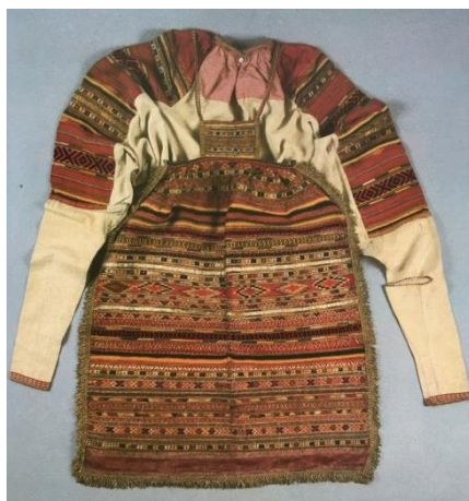
Рисунок 12. Чехлик (женская рубаха) и передник. Конец 19 в.

Узоры и вышивки простых элементов обращал на себя внимания для благодаря ярким и звонким цветам и масштабностью. Затканые сплошь узкими полосками красного, желтого, светло-коричневого цвета обогащали и делали наряд нарядным и уникальным (рис. 9).