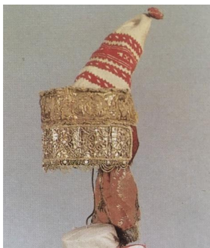
Рисунок 7. Головной убор девушки. Вторая половина 19 в.

Знаковым методом отделки праздничной одежды являлось золотая вышивка. «Золотошвейки пользовались пряженными или волчкеными нитям, битью – тонкой узкой полоской металла, канителью – скученной спиралью тонкой проволокой, плетёнными шнурками. Металлическая нить накладывалась на ткань и в разнообразных комбинациях-ритмах прикреплялась мелкими стежками шелковой или льняной нитью» [1]. Золотом шили на разных видах материала бархат, коже, шелку, кисее (рис. 7).