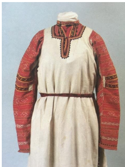
Рисунок 8. Костюм девичий. Начало 19 в.

Другие южнорусские губернии использовали для вышивки нити черного цвета из шелка или шерсти. Данный орнамент особенно обращал внимания благодаря белому массиву ткани одежды.