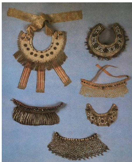
Рисунок 11. Шейные украшения. 19 в. – начало 20 в.

Метод аппликации использовался для украшения такого элемента одежды как «языки» и «грудки», которые могли быть нашейные или нагрудные. Такой комплект мог быть из вышивки золотой нити и шелка, с вставками из фольги и стекла, жемчуга (рис. 11).