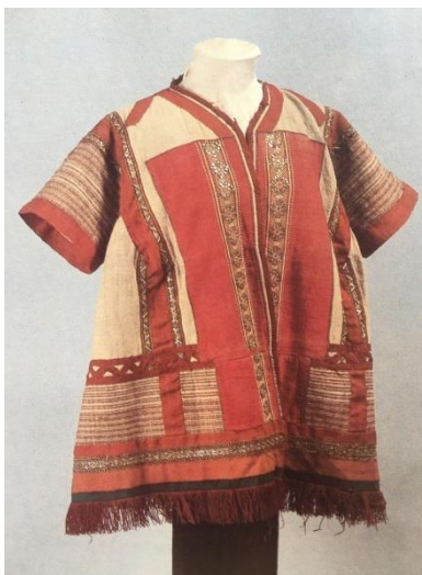
Рисунок 1. Шушпан. Вторая половина 19 в. Рязанская губ

Женский, народный, южнорусский костюм являлся многослойным и многосоставным. Одежда подразделялась по основному роду и быту такие как нательная, домашняя, и верхняя. В составе бытового костюма являлась длинная холщовая рубаха, поверх которой женщина надевала поневу – набедренную одежду. Домашняя одежда шилась из домотканой клетчатой или полосатой пестряди, или набойки и почти не украшалась. Важным элементом женского гардероба был передник, по своей конструкции разделялся на несколько типов. Один из них – надеваемый через голову, туникообразный передник с рукавами или узкими проймами – обычно входил в комплекс с поневою, бытовал главным образом в центральных и южнорусских губерниях, под названием «занавеска», «запон». Далее следовала нагрудная одежда, находившееся чуть ниже пояса, которая имела различные названия – «шушун», «сукман», «шушпан», «навершник» (рис. 1).