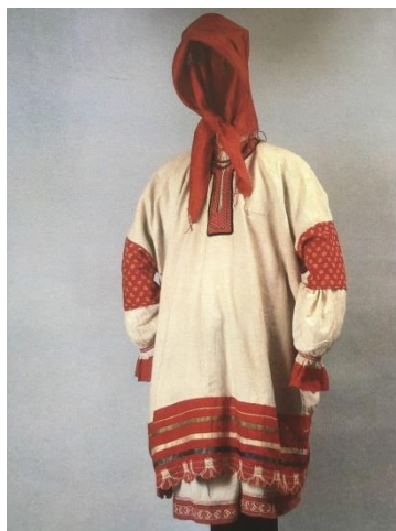
Рисунок 2. Костюм молодой женщины. Конец 19 в. – начало 20 в. Калужская губ.

Иной комплект женского гардероба составлял сарафан и рубаха. Так же можно отметить, что одежда подчеркивала семейные и возрастные отличия. Например, у юной особы, примерно до пятнадцатилетнего возраста, единственной одеждой являлась рубаха, а одежда мальчиков и девочек до семилетнего возраста была полностью одинаковой и состояла из длинной подпоясанной рубахи, сшитой обычно из старой одежды родителей. Девушки носили косоклинный сарафан, холщовую юбку «подол». У молодых женщин преобладали яркие цвета и набедренная одежда-понева, у пожилых одежда была темного цвета (рис. 2).