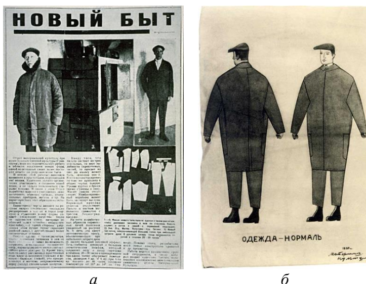
а б Рисунок 3. Модели «нормаль-одежды» В.Е. Татлина: а — пальто и костюм, 1924 г. 4 ; б — эскиз модели, 1923 г. 5

Ещё одним примером многофункциональной одежды может служить женский брючный костюм Ив Сен-Лорана, который в 1966 году совершил революцию в мире моды. Он подарил женщине свободу и власть, с которыми ассоциировался мужской костюм. Созданный новый образ женщины от Ив Сен-Лорана вошел в классику моды, после того как его коллекцию «Le Smoking» запечатлели в фотосессии для Vogue (рис. 4).