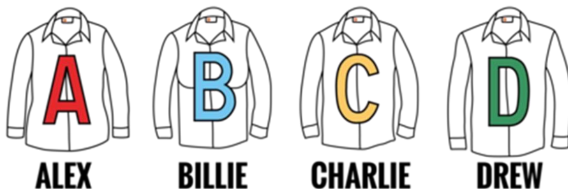
Рисунок 7. Условные изображения силуэтов ассортимента GFW Clothing 13

Они разработали способ идентификации фигуры потребителя в соответствии с установленным типом для выбора предпочтительных моделей одежды. GFW на своём сайте дают потребителю подробные инструкции для определения своего типа фигуры и последующего соотнесения её с конкретной моделью из предложенного ими ассортимента. Дизайнеры этой фирмы разработали 4 типовые модели со свободной посадкой «loose fit» на 4 условные фигуры. Каждая условная фигура маркирована своим (гендерно нейтральным) именем по алфавиту (A — Alex, B — Billie, C — Charlie, D — Drew) (рис. 7).