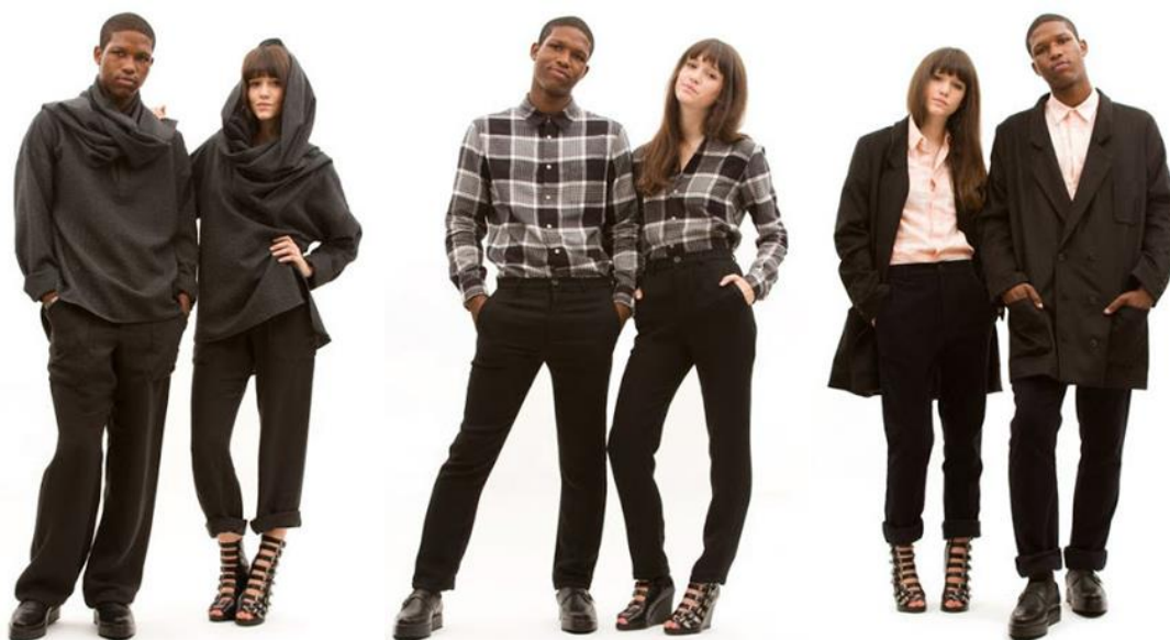
Рисунок 5. Коллекция одежды в стиле унисекс Хлое Севиньи 10

В мире моды на сегодняшний день практически отсутствует граница между мужским и женским. Динамично меняющийся мир через модные образы демонстрирует отказ от стереотипов фиксации личности невозможности фиксации личности [10]. «Эпоха постмодернизма предложила современникам выбор самоидентификации. Больше не существует запрета на выбор ассортимента, цвета, материала, степени декоративности оформления в костюме по половому признаку» [11].