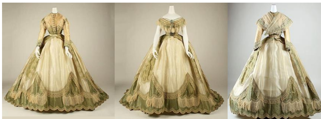
Рисунок 1. Платье со сменными лифами, 1860-е гг. 1

Идея придать одежде множество функций зародилась ещё у народов древнего мира. Профессиональный подход в реализации идеи многофункциональной одежды можно наблюдать во второй половине XIX века. Например, Чарльз Фредерик Ворт предложил платье со съёмными лифами. Одна юбка дополнялась несколькими вариантами лифов. В результате одно и тоже платье женщины могли использовать для разных целей, например, платье из визитного могло преобразоваться в обеденное, а из обеденное в бальное (рис. 1).