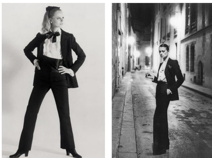
Рисунок 4. Женский брючный костюм Ив Сен Лорана: а — коллекция от кутюр осень/зима 1966 г. 6 ; б — «Le Smoking», фото Хельмута Ньютона, 1975 г. 7

Ещё одним примером многофункциональной одежды может служить женский брючный костюм Ив Сен-Лорана, который в 1966 году совершил революцию в мире моды. Он подарил женщине свободу и власть, с которыми ассоциировался мужской костюм. Созданный новый образ женщины от Ив Сен-Лорана вошел в классику моды, после того как его коллекцию «Le Smoking» запечатлели в фотосессии для Vogue (рис. 4).