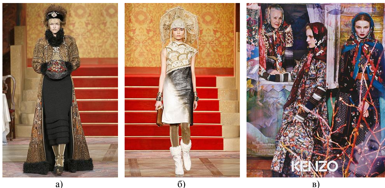
Рисунок 2. Работы К. Лагерфельда 2008–2009 гг. (а, б) 5 , Антонио Маррас дом Кензо 2009 (в) 6

Можно отметить, что этномотивы в моде уже не первый сезон, но их многообразие не перестает удивлять. Особенно примечательно, что мировые дизайнеры также обращаются к богатой русской культуре. Об этом можно судить по коллекциям Ж.-П. Готье, К. Лагерфельда и других дизайнеров (рис. 2).