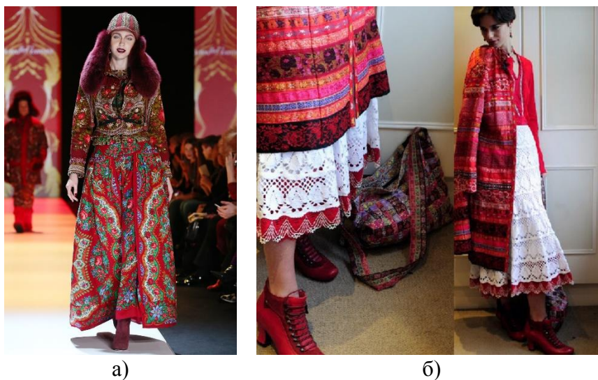
Рисунок 1. Работы В. Зайцева 2018 3 (а); Д. Разумихиной 2016 4

вдохновения и неиссякаемого творческого потенциала для дизайнеров являются различные фольклорные русские мотивы. Об этом можно судить по коллекциям Дарьи Разумихиной, Вячеслава Зайцева, Ульяны Сергеенко, Андрея Артемова других дизайнеров 2 (рис. 1).