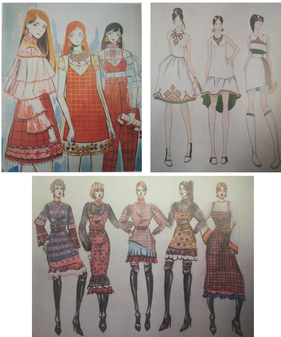
Рисунок 5. Студенческие работы по мотивам удмуртского народного костюма