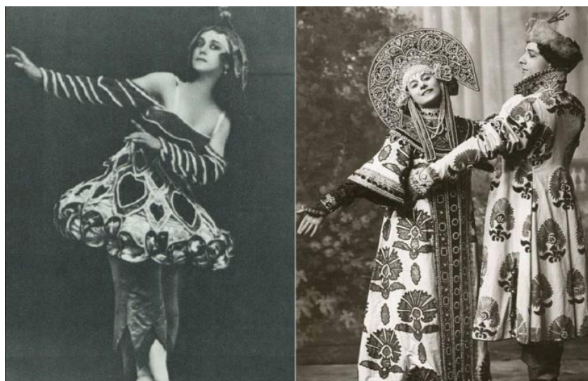
Рисунок 6. Фото. «Русские сезоны» С. Дягилева. Сцены из балета «Жар-птица», 1910 г.

Проходившие с 1908 по 1929 год «сезоны» смогли пробудить и удержать интерес публики и создать русскому искусству положительную репутацию за рубежом. Но, несмотря на поставленную лишь «пропагандистскую» цель, русские сезоны смогли предложить гораздо больше, чем ностальгические отсылки к русской старине. Балеты русских часто были авангардными, экспериментальными и привлекали лучших творцов не только из России, но и зарубежных (рисунок 6).