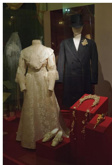
Рисунок 2. Фото. Свадебный костюм кон. XIX нач. XX в. Коллекция Н. Костригиной

При этом следует добавить, что элементы, особенно орнаментальные мотивы традиционного русского костюма активно использовались в качестве декора в других областях проектирования – архитектуре, дизайне мебели и проча, но в области создания городской одежды они долгое время не подвергались творческому переосмыслению [5].