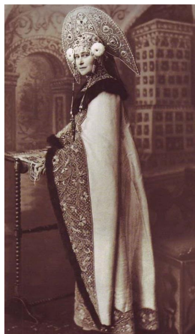
Рисунок 4. Фото. Великая княгиня Елизавета Федоровна. Костюмированный бал, 1903 г. Зимний дворец