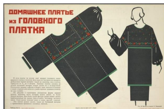
Рисунок 10. Н. Ламанова, В. Мухина. Домашнее платье из головного платка, 1925 г.