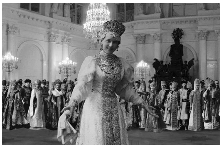
Рисунок 5. Фото. Княгиня Зинаида Юсупова. Костюмированный бал, 1903 г. Зимний дворец

Третий этап , напрямую связан с ярким культурным событием, определивший интерес ко всему «русскому» на десятилетия вперед. Это «русские сезоны», организованные С.П. Дягилевым – гастрольные выступления русских артистов оперы и балета. Пропаганда русского искусства за рубежом была сознательной целью организатора «сезонов», мецената Сергея Павловича Дягилева, которой он занимался и ранее, устраивая выставки русских художников в Париже, Берлине, Монте-Карло и Венеции.