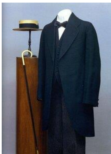
Рисунок 1. Фото. Городской костюм вт. пол. XIX нач. XX в. Государственный Исторический музей