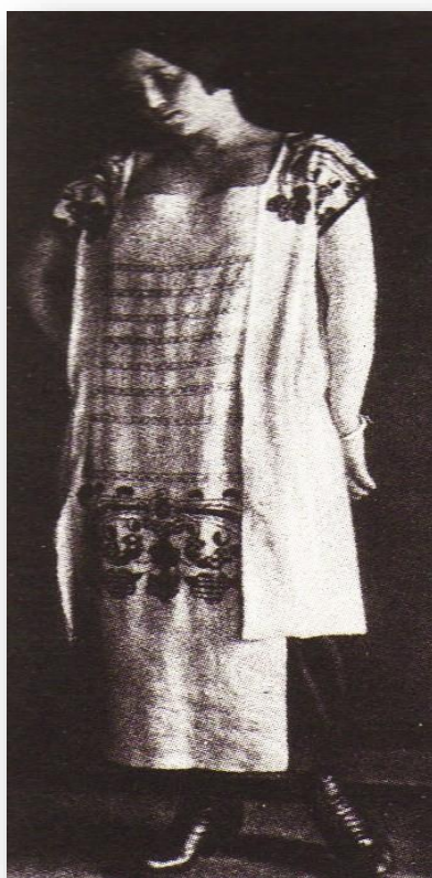
Рисунок 8. Фото. Н. Ламанова. Образцы женских платьев из кустарных тканей. 1920-е гг.

Из оставшихся в России дизайнеров, для понимания истории «русского стиля» в костюме, важно отметить творчество Надежды Петровны Ламановой. Её интерес к традиционному русскому костюму наиболее ярко выразился в моделях платьев, представленных на международной выставке в Париже в 1925 году. Модели были удостоены «Гран-при» и отмечены как выдающиеся модели, основанных на народном творчестве. Так же глубинным изучением традиционного народного костюма отличается иллюстрированная серия «Костюм в быту», созданная совместно с художницей Верой Мухиной (рисунком 8–10) [9].