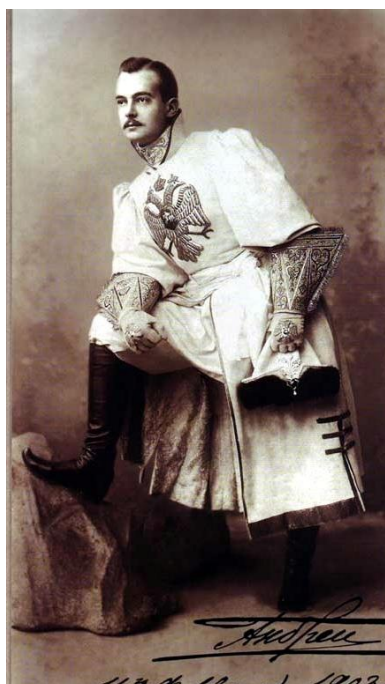
Рисунок 3. Фото. Великий князь Андрей Владимирович. Костюмированный бал, 1903 г. Зимний дворец

Второй этап определившим формирование «русского стиля» в одежде, стал знаменитый костюмированный бал 1903 года в Зимнем Дворце. Его участникам предписывалось наряжаться в костюмы допетровской эпохи, что они сделали с большим энтузиазмом и размахом. Являясь скорее примером исторической реконструкции, чем дизайна, этот бал пробудил интерес к богатству русского костюма, показал его разнообразие и творческий потенциал (рисунок 3–5) [6].