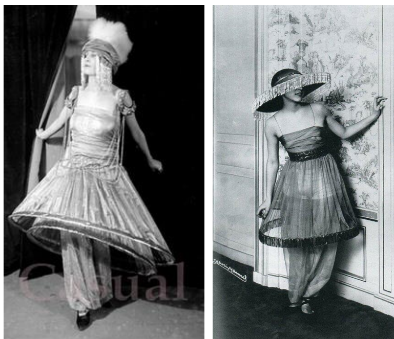
Рисунок 7. Поль Пуаре. Костюмы в восточном стиле, 20-е гг. XX в.

Наряды в русском стиле в интерпретации Поля Пуаре включают платья из парчи с драгоценной вышивкой, набивные рисунки по мотивам узоров павлопосадских платков, аксессуары и отделку из меха (рисунок 7) [8].