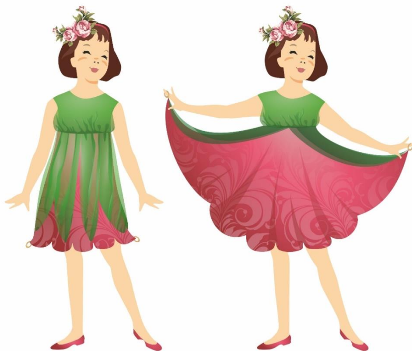
Рисунок 4. Эскиз модели многофункционального сценического костюма «Аленький цветочек». Автор Журавлёва А.