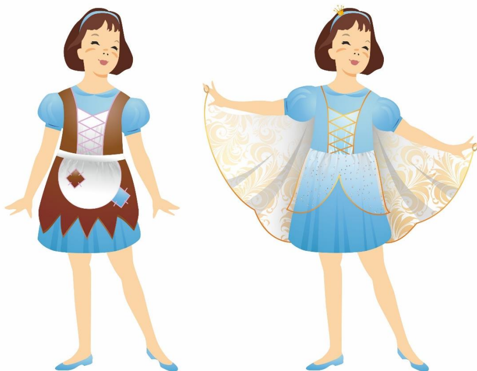
Рисунок 2. Эскиз модели многофункционального сценического костюма «Золушка-принцесса». Автор Журавлёва А.