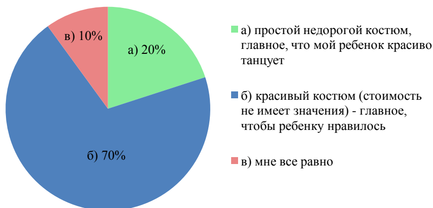
Рисунок 7. Факторы, влияющие на выбор костюма родителями

По диаграммам (рисунки 7–8) видно, что большинство родителей согласны приобрести более дорогостоящую модель. Обоснование выбора модели родителями было тем, что этот костюм multifunctional, который позволяет им сократить расходы на приобретение нового изделия для последующего выступления.