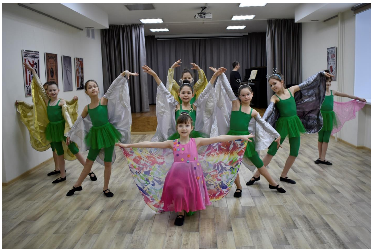
Рисунок 12. Хореографический коллектив «Меланж» академии искусств г. Чебоксары