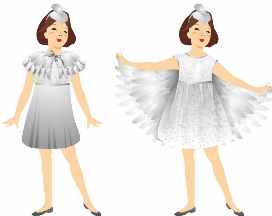
Рисунок 5. Эскиз модели многофункционального сценического костюма «Гадкий утенок-лебедь». Автор Журавлёва А.