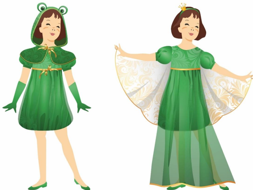
Рисунок 3. Эскиз модели многофункционального сценического костюма «Царевна-лягушка». Автор Журавлёва А.