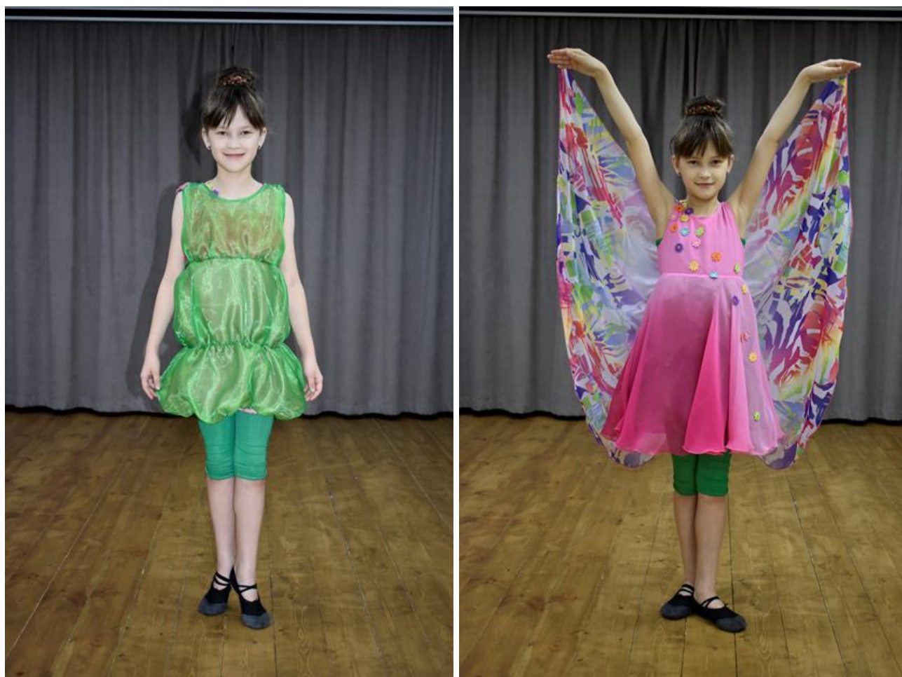
Рисунок 11. Фото готового изделия