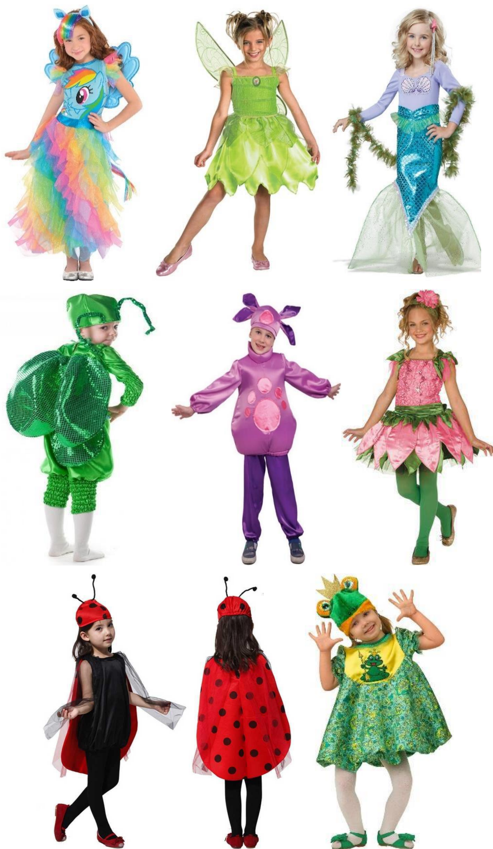
Рисунок 1. Примеры костюмов сказочных героев