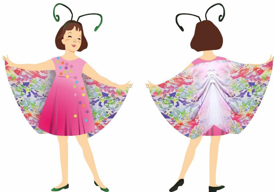
Рисунок 10. Эскиз модели сценического костюма «Гусеница-бабочка». Автор Журавлёва А., руководитель Леонова Е.В.