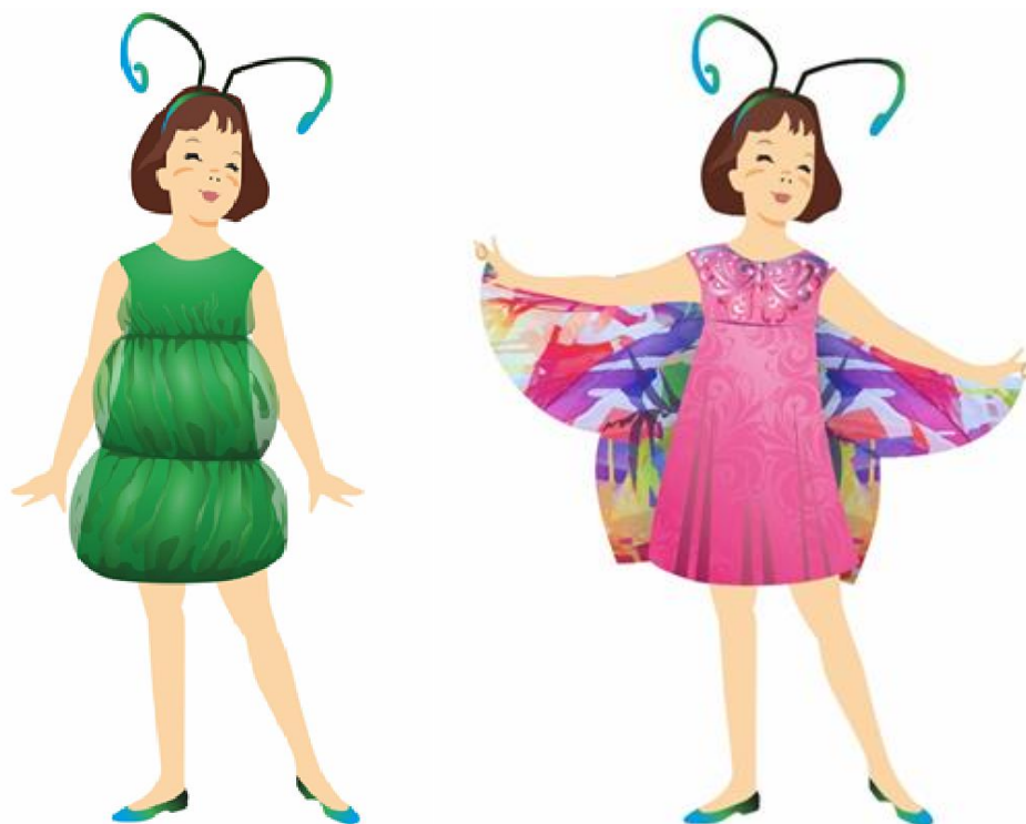
Рисунок 6. Эскиз модели многофункционального сценического костюма «Гусеница-бабочка». Автор Журавлёва А.