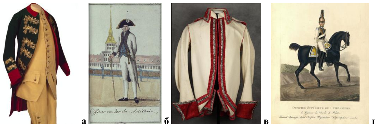
Рисунок 3. Мундиры гвардейцев: а — Мундир Преображенского полка, 1762 г. 1 ; б — Офицер морской артиллерии, 1770 г. 2 ; в — Солдатский кавалергардский мундир, 1790 г. 3 ; г — Штаб-офицер лейб-гвардии Подольского кирасирского полка, 1851 г. 4

Эволюция мундира напрямую повлияла на женское мундирное платье, заимствовавшее фасоны, декоративные приёмы и колористику офицерской формы. Военная одежда послужила основой для формирования уникального направления в русском costume, где сочетаются элементы дисциплины, эстетики и национальной гордости [8].