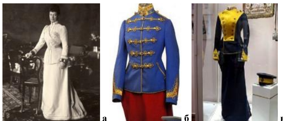
Рисунок 2. Мундирные платья императриц: а — Марии Фёдоровны по форме лейб-гвардии Кирасирского Е.И. В. собственного имени полка, 1890-е [4]; б — Ольги Николаевны, дочери Николая II, по форме 3-го Елизаветградского гусарского полка, 1911 [4]; в — Татьяны Николаевны, дочери Николая II, по форме 8-го Вознесенского уланского полка, 1911 [4]

В XIX веке развитие мундирного платья продолжилось благодаря женам российских императоров: Марии Фёдоровне (1759–1828), Александре Фёдоровне (1825–1855), Марии Александровне (1824–1880) и их дочерям (рис. 2 а–в). Каждая из них адаптировала элементы военной формы к современным модным тенденциям. Особенно выделялась Мария Фёдоровна (1847–1928), в чьём гардеробе сочетались строгость линий и изящество композиции, что подтверждается музейными экспонатами [4].