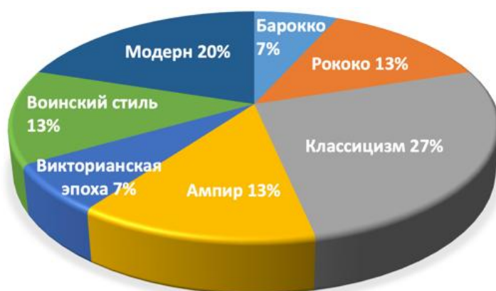
Рисунок 6. Диаграмма анализа стиля мундирного платья (составлено авторами)

Двор Российской Империи также, как и другие государства, следила за развитием тенденций моды. Однако стиль не существовал отдельно сам по себе, тренды развивались постепенно с плавным переходом, а также внедрялись в уже существовавший русский костюм. Благодаря чему, Россия имеет уникальную модную историю, несмотря на значимое влияние Запада. Выполненная диаграмма демонстрирует, какие стилевые решения были наиболее популярными в создании мундирного платья. Классицизм имеет самую большую долю — 27 %. Мундирные платья с элементами классицизма создавали в эпоху правления Екатерины Великой, создавая самое большое количество мундирных комплектов. Второе место занимает модерн — 20 %, появившийся в конце XIX века. Изделия этого стиля были реализованы в семье Николая II: мамой Марии Федоровной и дочерьми Татьяной Николаевной и Ольгой Николаевной. Рококо, Ампи́р и Воинский стиль имеют по 13 % и существовали в разные временные периоды, а барокко и викторианская эпоха по 7 % или всего лишь по одному платью каждый (рис. 6).