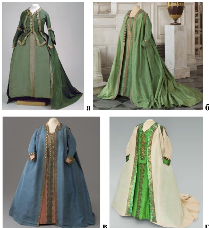
Рисунок 4. Мундирные платья Екатерины Великой по форме:

Мундирное платье по форме Преображенского полка (рис. 4 а) выполнено из бархата и шелка в зелёной гамме, украшено золотым галуном и позолоченными пуговицами. Оно объединяет строгие линии военного мундира и декоративность рококо. Аналогичное по духу платье по форме Семёновского полка (рис. 4 б) имеет светло-зелёную окраску, сложную отделку и длинный шлейф, отражая переход от рококо к классицизму.