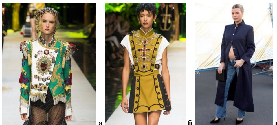
Рисунок 7. Современные коллекции: а — «Dolce & Gabbana», весна-лето 2017; б — «Dolce & Gabbana», весна-лето 2017; в — София Ричи Грейндж на показе Vogue 26 октября 2025 года

перекликаются с историей мундира как знака власти, чести и структуры — и именно они служат примером того, как военная форма трансформируется в дизайн-код. 10