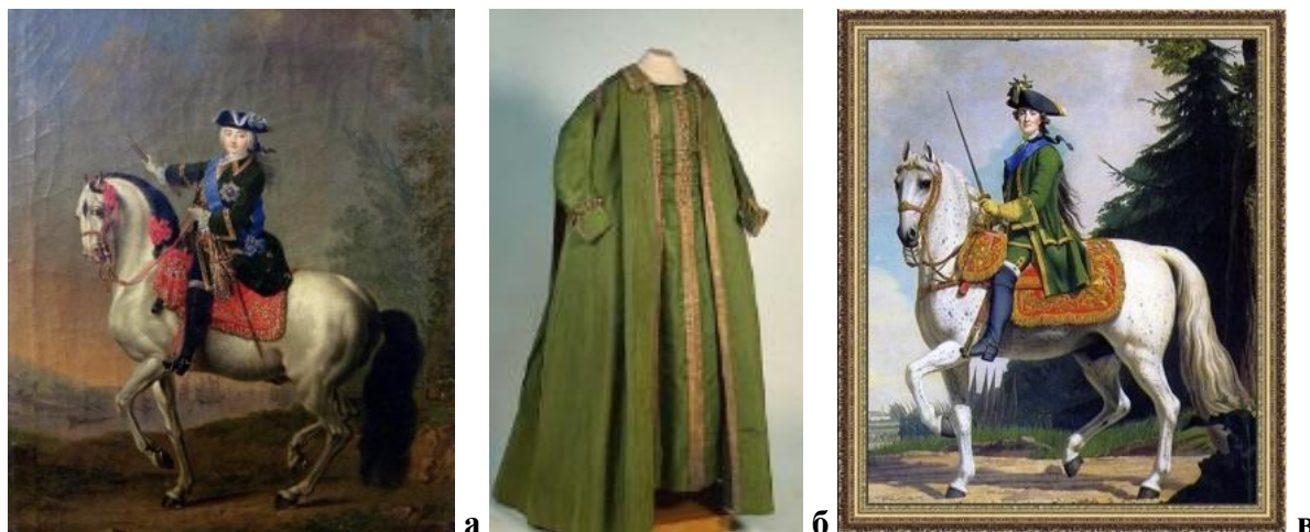
Рисунок 1. Мундиры и мундирные платья императриц: а — портрет Елизаветы Петровны в мужском мундире [2]; б — мундирное платье Екатерины II по форме Преображенского полка, 1785 г. [3]; в — портрет Екатерины II в мужском мундире [3]

Екатерина Великая, обладая глубоким политическим чутьём, использовала костюм как средство самоидентификации и государственной репрезентации. Она инициировала создание женских нарядов, выполненных по форме военных мундиров различных полков (рис. 1 б, в). Эти платья сочетали французский крой и военную символику: на них присутствовали лацканы, обшлага, застёжки и манжеты, но сохранялась женственная линия силуэта [3].