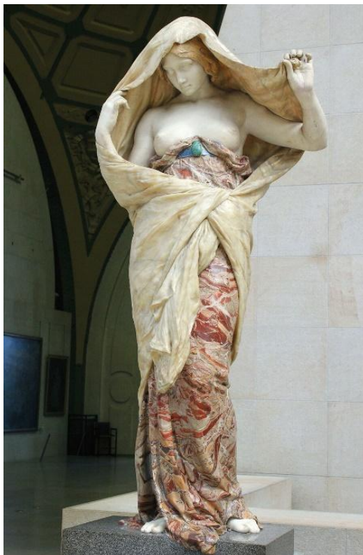
Рисунок 1. «Природа, раскрывающаяся перед Наукой», 1899 г., Луи-Эрнест Барриа, Музей д'Орсе в Париже 3

более узкий покрой. Цветовым акцентом служит поддерживающая лента под грудью кобальтового оттенка с акцентом на скарабее из зеленого малахита. Подпоясывание хитона под грудью характерно для замужних женщин Древней Греции, равно как и максимальная длина облачения. Обрамляет укрывающуюся фигуру драпированный и зафиксированный узлом на поясе гиматий из камня оттенка охры.