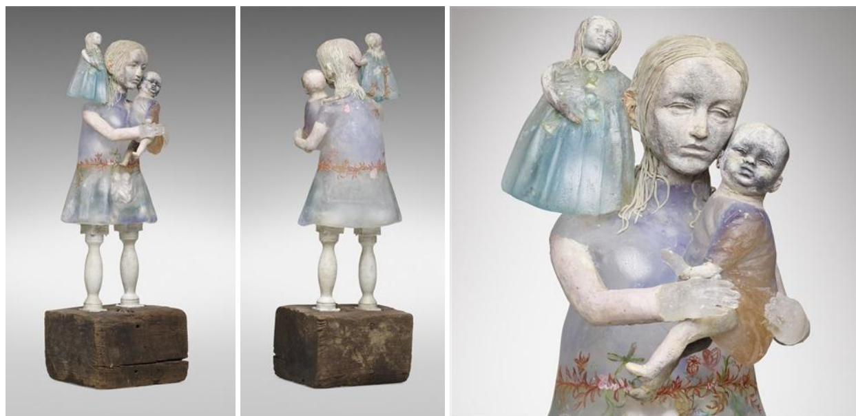
Рисунок 2. «Всё снова по-новому», 2001 г., Кристина Босуэлл 4