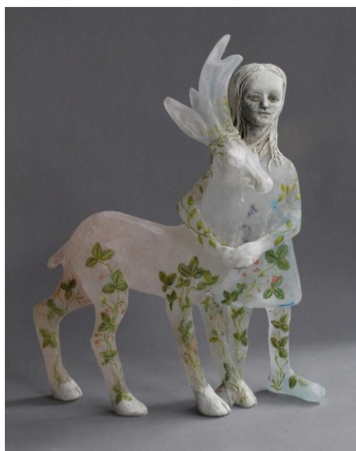
Рисунок 3. «Клубничные сады», 2020 г., Кристина Босуэлл 5

Создавая свои полноразмерные объемные фигуры, корейская художница Jin Young Yu совмещает прозрачный поливинилхлорид с колорированными деталями из глины. Силуэты фигур лаконичны и построены на контрасте, словно растворенных в среде прозрачных деталей с декоративными орнаментально окрашенными фрагментами. Автор совмещает прозрачные сегменты в чистом виде, с одноцветной тонировкой и живописной детализированной покраской лиц. Детали костюма и раппортные принты одежды создают особый акцент цельного образа (рис. 4). Чулки, сумочки, воротнички и платья словно парят в воздухе,