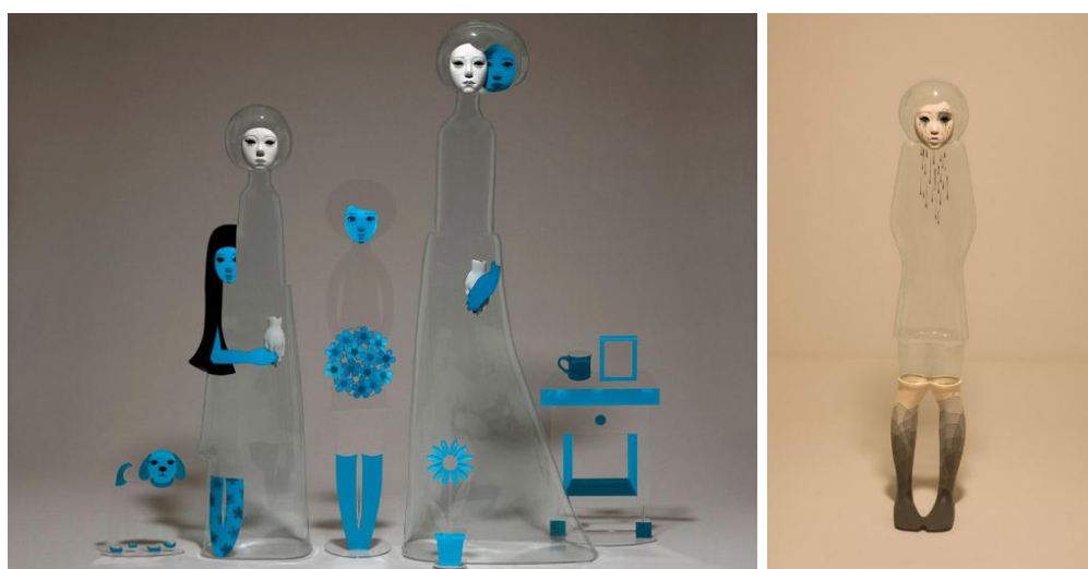
Рисунок 5. «Невидимые люди», 2007 г., Цзинь Ен Ю 7