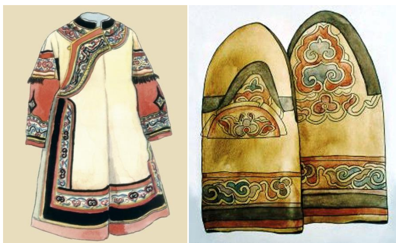
Рисунок 4. Элементы традиционного костюма орочей 8

Орнаментальные мотивы орочей — спирально-ленточные и отражали, несмотря на свой внешне чисто геометрический характер, внешние контуры животных и природных элементов. Для пошива одежды использовали ровдугу, рыбью кожу, шкуру таежных и морских животных, покупные хлопчатобумажные ткани. В орнаментике преобладали яркие цвета — белый, желтый, красный, зелёный и синий. Мозаичные узоры обычно наносились на одежду и предметы быта. Летний костюм дополняла берестяная шапка, зимний — меховая (рис. 4). Для повседневной носки использовали башмаковидную обувь, для ходьбы на лыжах — поршневидную в виде унт 7 .