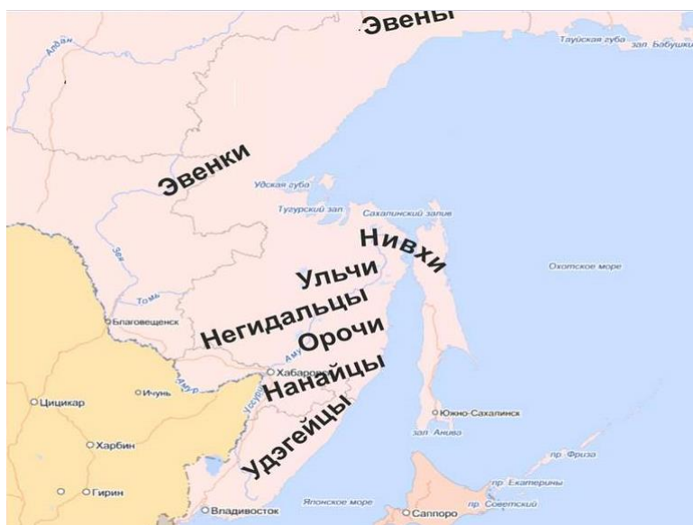
Рисунок 1. Территория проживания коренных малочисленных народов Хабаровского края 2

В своих научных трудах С.В. Березницкий рассматривает происхождение орочей как народа смешанного происхождения (нанайцы, ульчи, негидальцы, удэгейцы, возможно также айны и нивхи) [9].