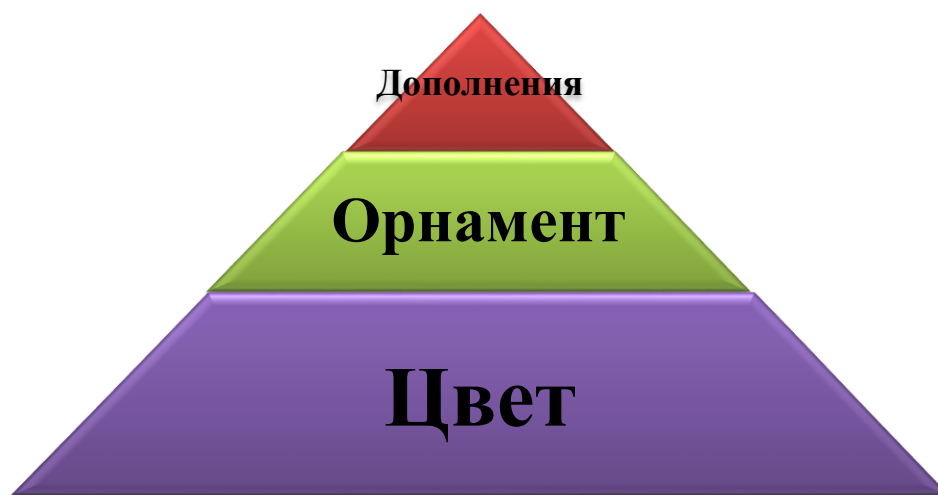
Рисунок 7. Приоритетность в традиционном костюме народов тунгусо-маньчжурской языковой группы (разработано авторами)

Данные таблицы 1 показывают, что народы тунгусо-маньчжурской языковой группы в национальных костюмах имеют много схожих колористическо-орнаментальных элементов, но в тоже время различаются конструктивно-декоративными элементами, в том числе головными уборами и обувью. Приоритетом костюма являлось колористическое решение. Далее уделялось внимание орнаменту, который для рассматриваемых этносов представлял волнообразные и спирально-ленточные линии, преимущественно отражающие растительный орнамент. И в завершении уделяли внимание головным уборам и элементам обуви, что носило утилитарный характер, и было необходимо для защиты тела от неблагоприятных атмосферных воздействий (рис. 7).