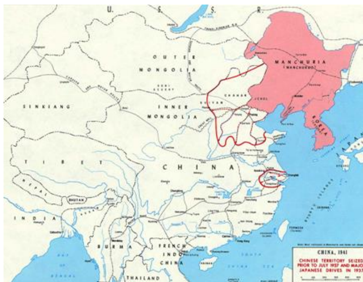
Рисунок 2. Территория Маньчжурии 4