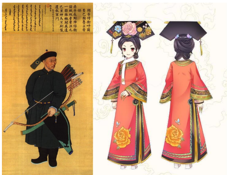
Рисунок 6. Мужской и женский традиционный наряд маньчжуров 10

Праздничный костюм маньчжурских женщин дополняло головное украшение, по форме напоминающее веер. Это аксессуар из металлического или бамбукового каркаса, на который натягивалась мягкая тонкая ткань, украшался искусственными цветами, вышивкой, жемчужинами, лентами и крепился на собранные в узел волосы (рис. 6). Обувь носили изысканную на подошве с высоким «каблуком» — выступом под центральной частью стопы, которая была выполнена из ткани с тонкой вышивкой.