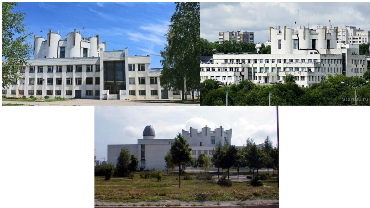
Рисунки 2–4. Здание Дворца детского и юношеского творчества г. Владимира

И, наконец, главное – наш Дворец очень, очень красив. По замыслу архитекторов он выстроен как белоснежный корабль, плывущий по зеленым волнам окружающего его парка (рис. 2–4). Здание Дворца идеально вписано в ландшафт, сочетается с перепадами высот территории и каскадом прудов вокруг парка... До сих пор никакая застройка не коснулась его территории. Зимой он сливается со снежным пейзажем, и отблески фонарей играют на окнах, летом закаты и рассветы окрашивают его в розовато-бордовые тона... Соединение в архитектуре центрального элемента округлой формы, обрамленного геометрически четкими прямоугольными конструкциями, вертикальные линии, огромные панорамные окна, нестандартные пропорции придают ему оригинальный внешний вид, эстетичный и гармоничный. Ассиметрия расположения частей относительно центра создает динамическое развитие композиции, все элементы здания вместе создают целостность формы. Основной белый цвет сочетается с серебристым металлическим купола обсерватории и другими металлическими элементами. Перед входом во Дворец на газоне строители возвели фантазийную ажурно-прозрачную конструкцию из серебристого металла, олицетворяющую собой простор звездного неба. Сразу видно – это здание для творчества!