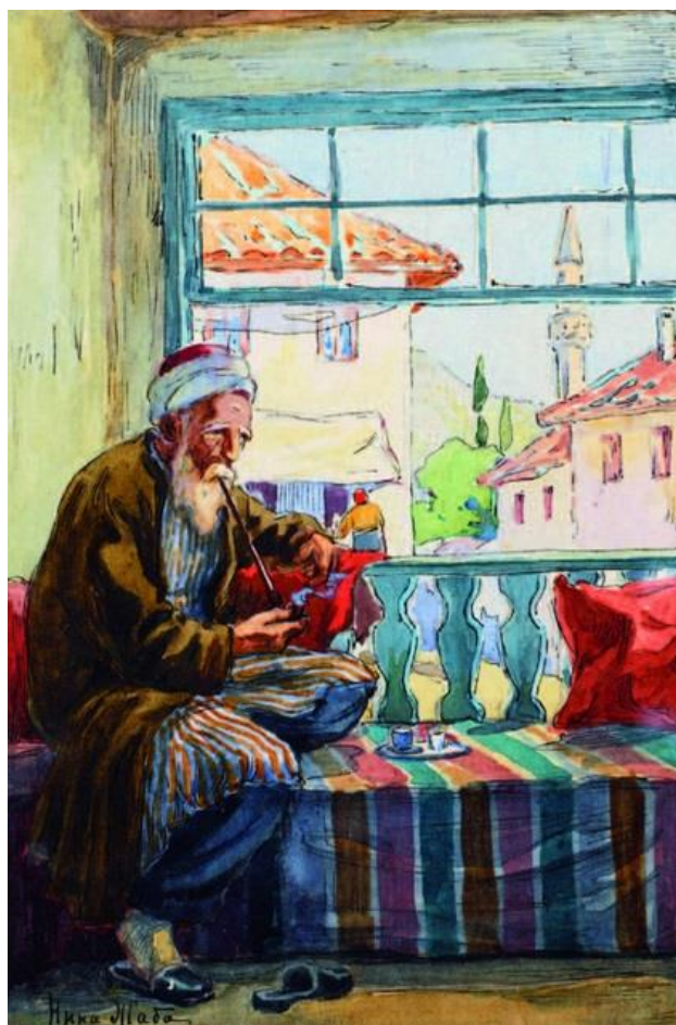
Рисунок 9. Н. Жаб. Старик с трубкой. Начало XX века. Бумага, акварель. Фонды Бахчисарайского историко-культурного и археологического музея-заповедника