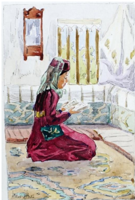
Рисунок 4. Н. Жаб. Девушка за чтением. Начало XX века. Бумага, акварель. Фонды Бахчисарайского историко-культурного и археологического музея-заповедника

В графической работе «Девушка за чтением» (рис. 4) художница изобразила крымскую татарку, облачённую в платье темно-пурпурного цвета за чтением Корана. На голове персонажа шапочка «фес» и тонкий платок «дуа», покрывающий волосы, так как считалось неприемлемым ходить без головного убора. Талию опоясывает пояс «кьолан», расшитый золотыми нитками, прекрасно сочетающийся с цветом платья. В данной работе автору удалось передать сосредоточенное состояние девушки за чтением, гармонично соединив интерьер помещения и фигуру в национальной крымскотатарской одежде.