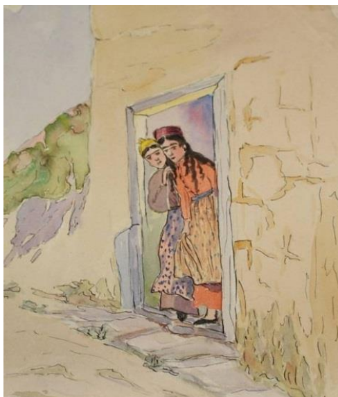
Рисунок 6. Н. Жабa. Выглядывающие девушки. Начало XX века. Бумага, акварель. Фонды Бахчисарайского историко-культурного и археологического музея-заповедника

готовящая кофе, на заднем плане композиции одета в розовый халат, ее голова покрыта жёлтым платком. В целом, художнице удалось передать объективную атмосферу быта, интерьера и одежды крымских татар, проживающих в Бахчисарае в начале XX века.