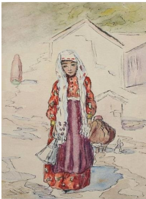
Рисунок 3. Н. Жаб. Девушка с кувшином. Начало XX века. Бумага, акварель. Фонды Бахчисарайского историко-культурного и археологического музея-заповедника

В графической работе «Девушка за чтением» (рис. 4) художница изобразила крымскую татарку, облачённую в платье темно-пурпурного цвета за чтением Корана. На голове персонажа шапочка «фес» и тонкий платок «дуа», покрывающий волосы, так как считалось неприемлемым ходить без головного убора. Талию опоясывает пояс «кьолан», расшитый золотыми нитками, прекрасно сочетающийся с цветом платья. В данной работе автору удалось передать сосредоточенное состояние девушки за чтением, гармонично соединив интерьер помещения и фигуру в национальной крымскотатарской одежде.