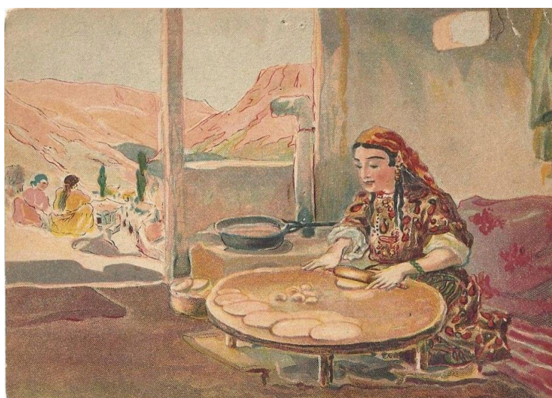
Рисунок 2. Н. Жабa. Крымская татарка за чебуреками. Начало XX века. Бумага, акварель. Фонды Бахчисарайского историко-культурного и археологического музея-заповедника

В этюде «Девушка с кувшином» (рис. 3) художница основное внимание уделила изображению молодой девушки, идущей с кувшином за водой. Одежда на модели каждодневная, но в каждой детали присутствует декор. Платье, платок «марама» и фартук гармонично сочетаются между собой по цвету. Нина Жабa плотным насыщенным пятном выделяет силуэт девушки, пейзаж и элементы архитектуры дополняют композицию и решены линейно, с лёгким применением тона и цвета.