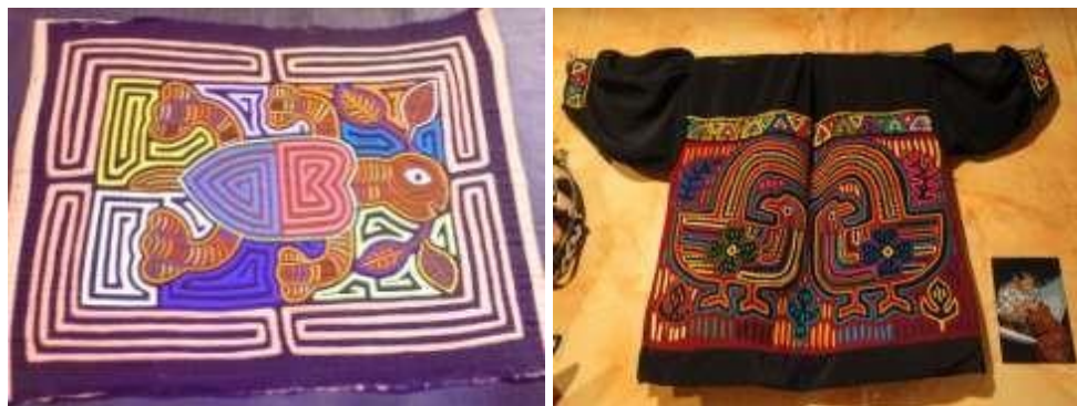
Рисунок 1. Примеры мол Кунов

Среди многообразия орнаментов и узоров индейцев, на наш взгляд, особенно выделяются мола Кунов (рисунок 1). На островах Карибского моря проживают индейцы племени Куна. Мола Кунов – самый известный промысел индейцев. Мола является частью традиционного костюма женщины Куна. Одна мола вшивается в переднюю, а другая в заднюю часть блузки. Термин мола (mola) используется для обозначения особого типа текстильных изделий, ставших этническими маркерами культуры индейцев куна.