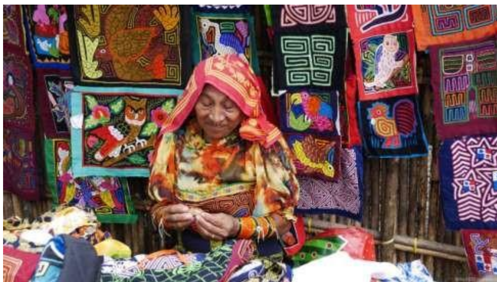
Рисунок 2. Коренная жительница продает молы туристам

Основное цветовое решение молы – яркий разноцветный рисунок на темном или красном фоне.