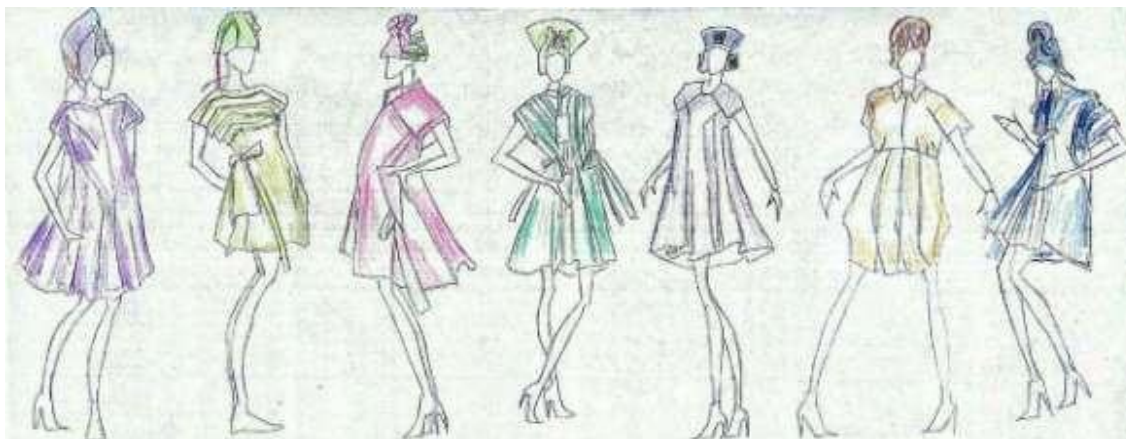
Рисунок 9. Колористическое решение коллекции платьев

Для второй эскизной разработки были выбраны цвета, подобные цветам пальто. При колористическом решении коллекции платьев было важно учесть, что платье и пальто должны гармонично смотреться в коллекции. В некоторых моделях цвета платьев перекликаются с цветами стёжки на пальто. В других цвета платьев сходны с цветами пальто на моделях (рисунок 9).