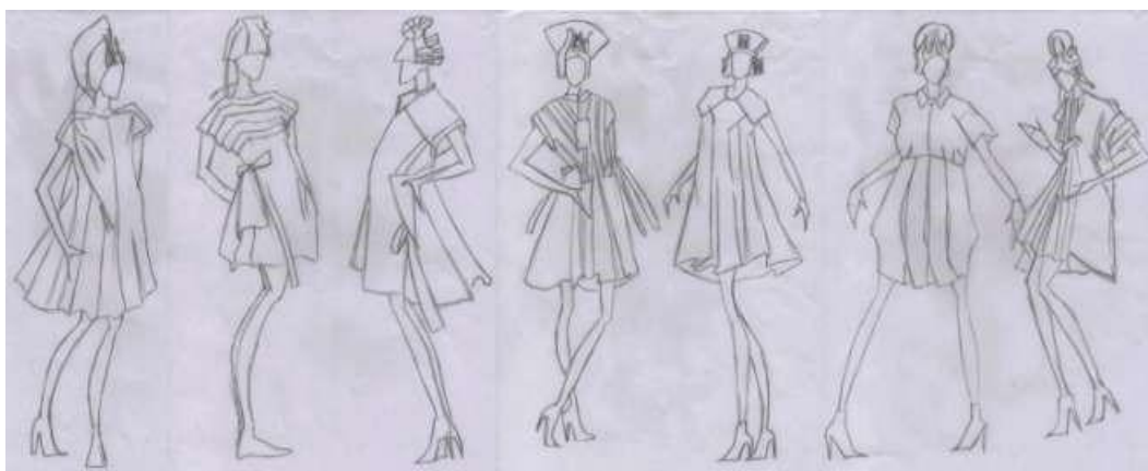
Рисунок 6. Эскизы платьев из коллекции «Перуанское Цвето-Представление»

На второй эскизной разработке можно видеть коллекцию платьев и головных уборов. На всех моделях представлены платья примерно одного объема и силуэта на одной конструктивной основе. Позы моделей на эскизах помогают показать отличительные особенности платьев. Развитие идеи источника творчества здесь отражено в разных видах отделки, декора, аксессуарах и головных уборах (рисунок 6).