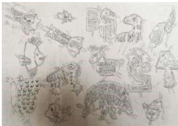
Рисунок 3. Наброски на основе источника творчества

Вдохновившись мотивами, фигурами, линиями мол Кунов было выполнено сопоставление деталей источника творчества с фигурой человека. В результате были разработаны первые форэскизы будущей коллекции (рисунок 3 и 4).