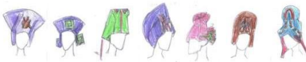
Рисунок 10. Колористическое решение коллекции головных уборов

В третьей эскизной разработке представлены головные уборы ярких цветов. В каждом изделии использовано сразу несколько цветовых сочетаний, которые отчасти повторяют цвета мол Кунов (рисунок 10).