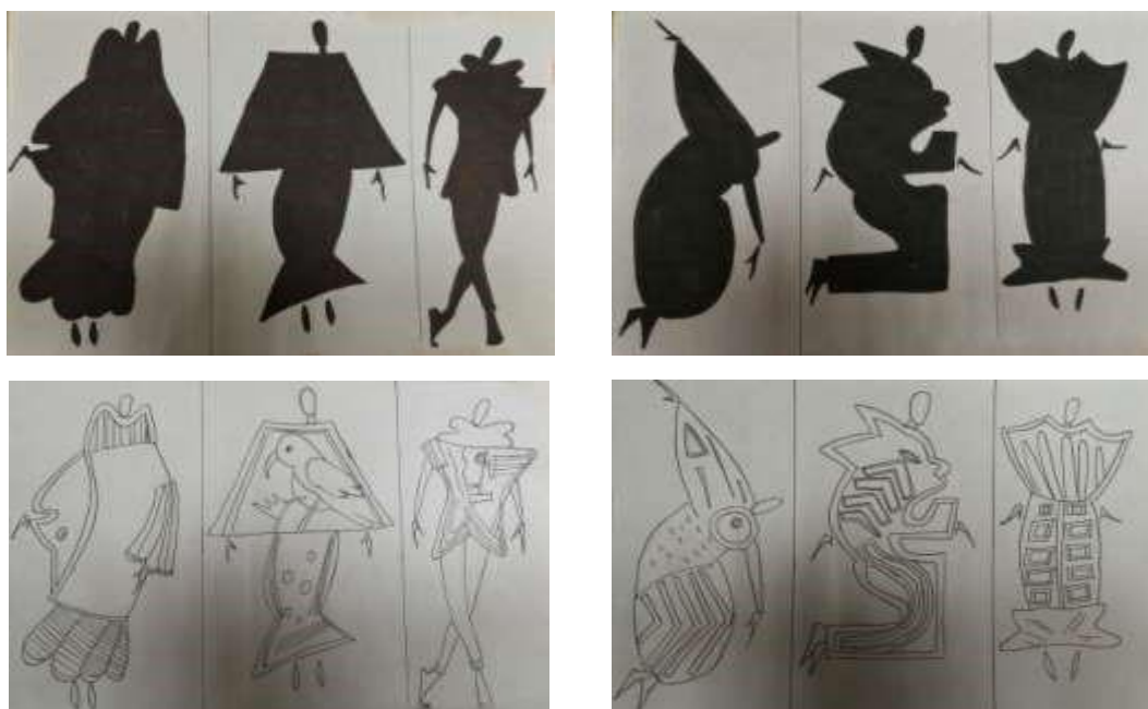
Рисунок 4. Первые форэскизы на основе источника творчества

Одними из особенностей одежды Кунов является многослойность ткани и объем. Поэтому на этом этапе было важно сохранить характерные черты одежды народов Перу. Также в коллекции должны быть отражены детали мол Кунов.