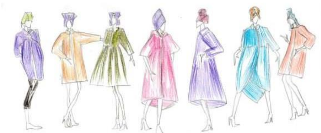
Рисунок 8. Колористическое решение коллекции пальто.

Для первой эскизной разработки были выбраны спокойные цвета с источника творчества. Чтобы выделить центральную модель коллекции, для одного из пальто был выбран яркий малиновый цвет. Стёжка должна чётко выделяться на фоне изделий, поэтому основным цветом стёжки стал горчичножёлтый. На остальных моделях стёжка выделяется с помощью ниток контрастного цвета (рисунок 8).