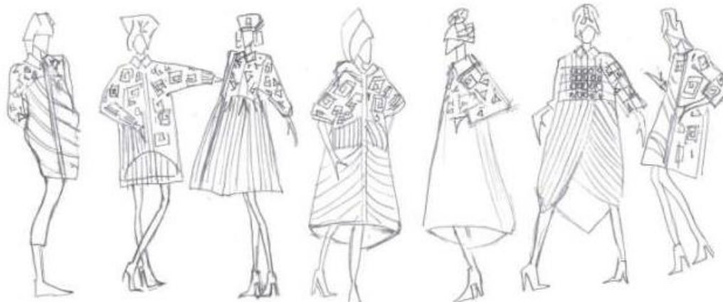
Рисунок 5. Эскизы пальто из коллекции «Перуанское Цвето-Представление»

На первой эскизной разработке представлены пальто коллекции с головными уборами. На моделях – стеганные пальто объемного силуэта и головные уборы, отражающие источник творчества. Стежка на пальто повторяет контуры орнаментов народов Перу. Позы моделей подчеркивают объёмность формы пальто. Благодаря необычной форме головные уборы отлично дополняют образы (рисунок 5).