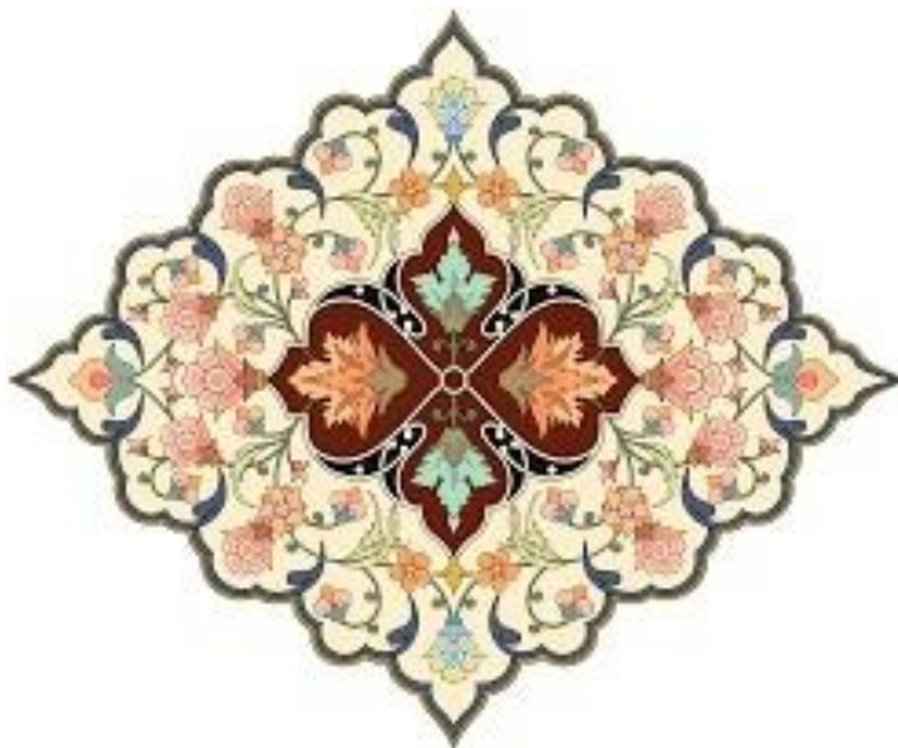
Рисунок 3. Прототипы орнаментов для росписи рубашки