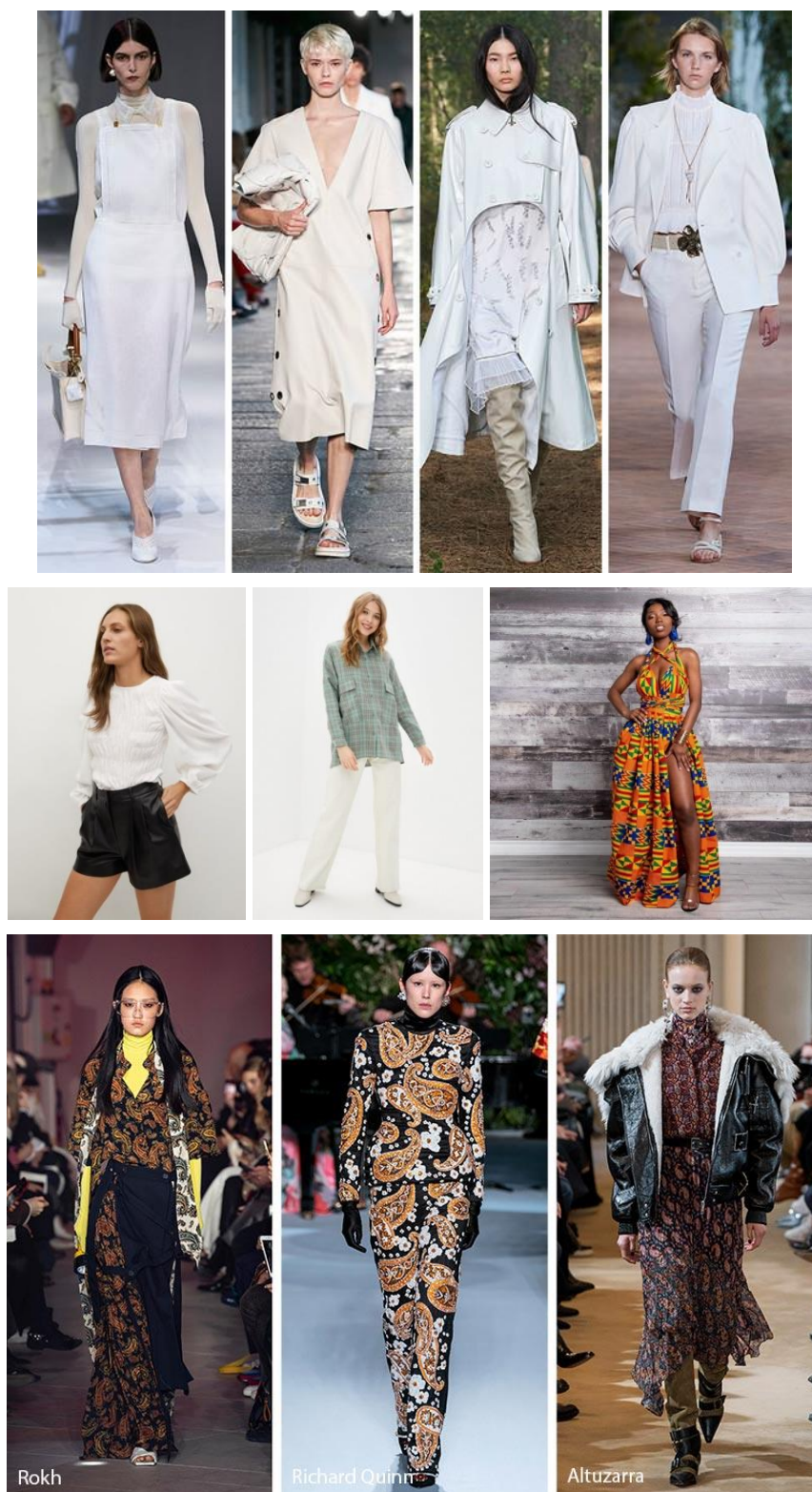
Рисунок 2. Примеры перечисленных трендов весна-лето 2021 года