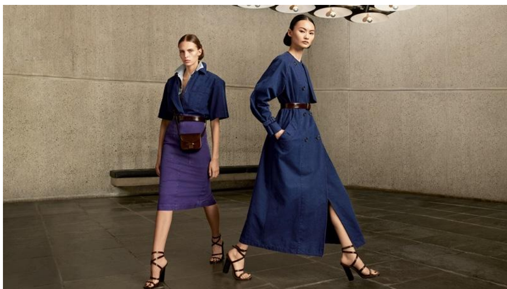
Рисунок 5. Кампейн бренда Max Mara Utilitarian Chic. Изображение электронное.