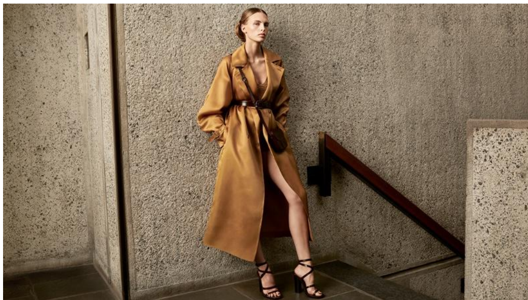
Рисунок 4. Кампейн бренда Max Mara Utilitarian Chic. Изображение электронное. Фото: Max Mara Spring 2024 Campaign: Utilitarian Chic // Fashion Gone Rogue, 24 февраля 2024 г., [сайт]. URL: https://www.fashiongonerogue.com/max-mara-spring-2024-campaign/ (дата обращения 18.05.2025)

Позиционирование по архетипу Правитель проанализируем на примере бренда Max Mara. 10 Рассмотрим кампейн 2024 года Utilitarian Chic. 11