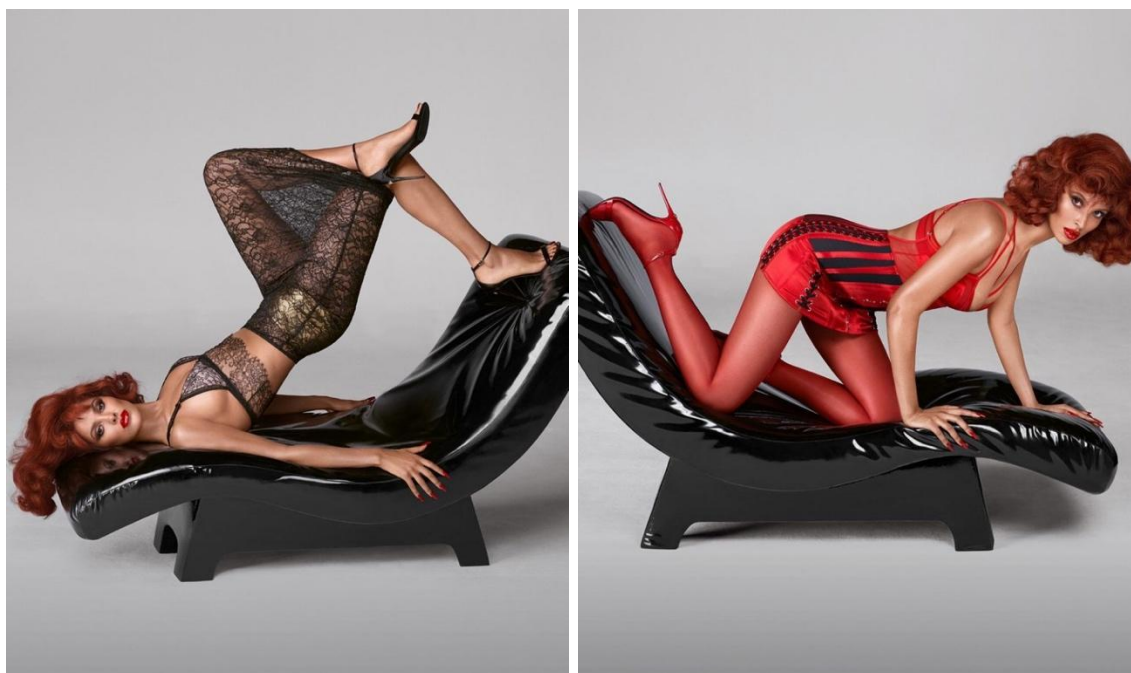
Рисунок 3. Майя Джема в кампании бренда Dolce & Gabbana. Изображение электронное. Фото: Dolce & Gabbana Fall 2023 Campaign: The Bold in Black // The Fashionisto, 14 сентября 2023 г., [сайт]. URL: https://www.fashiongonerogue.com/maya-jama-dolce-gabanna-fall-2023-ad/ (дата обращения 30.04.2025)

Анализируя визуальную айдентику кампании, можно наблюдать следующие маркеры, соответствующие маркерам архетипа Любовник: