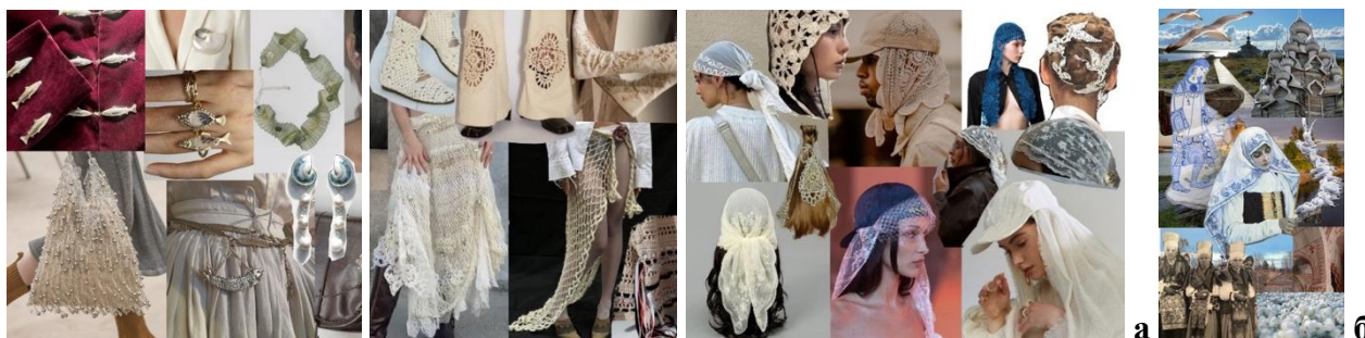
Рисунок 5. (а) Коллажи к некоторым основным пунктам; (б) Мудборд (авторское)

На основании этих пунктов были собраны коллажи, отражающие суть главных стилевых решений для лучшей визуализации будущей коллекции (рис. 5).