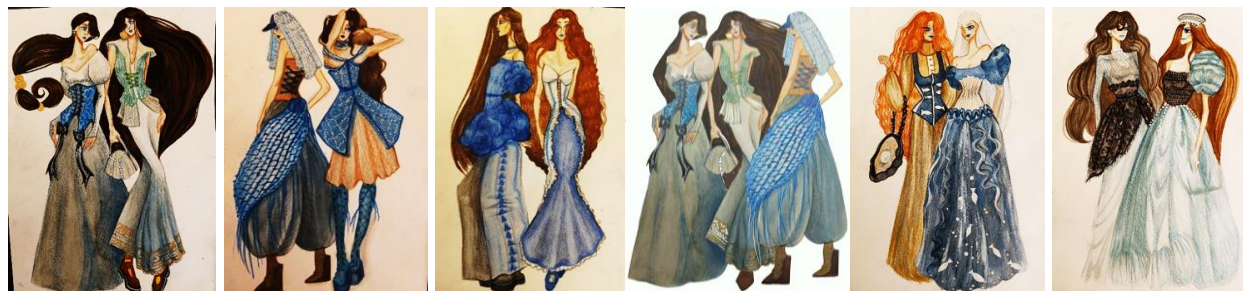
Рисунок 6. Эскизная коллекция (авторское)

На основе сформированной концепции и общего анализа современных модных трендов были созданы художественные эскизы (рис. 6).