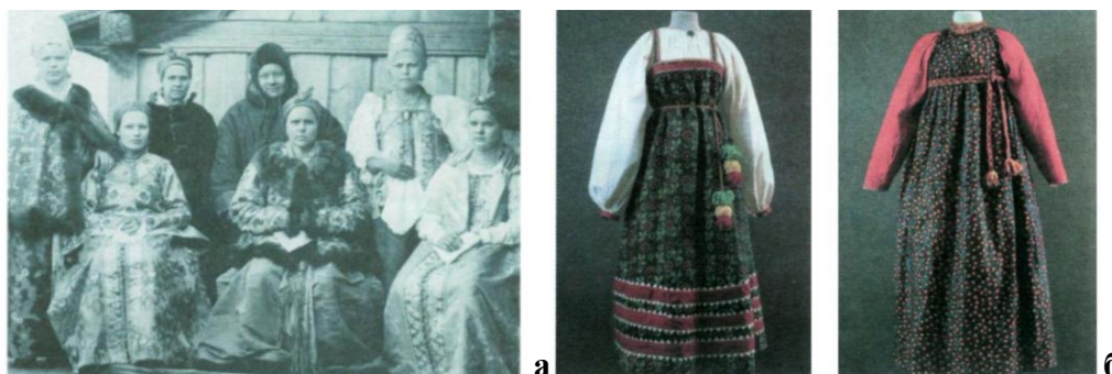
Рисунок 1. Национальные повседневные платья 1 : (а) Женщин Архангельской губернии; (б) Поморских женщин