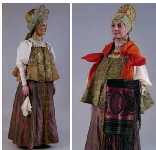
Рисунок 3. Традиционный поморский женский костюм с повойником 6

Поморская культура представляет исключительную ценность как источник понимания развития русской цивилизации. Север России сыграл выдающуюся роль в сохранении аутентичных элементов древнерусской культуры. В условиях, когда центральные области подвергались различным внешним влияниям и внутренним преобразованиям, поморское общество консервировало архаичные формы языка, фольклора, обрядов и материальной культуры. Поморская культура особенно значима тем, что она сохранила живую традицию исполнения былин, которые в поморской среде не превратились в историографический артефакт, а оставались составной частью повседневной жизни. Во время тяжёлой артельной работы по ловле рыбы, охоте на морского зверя, а также во время долгих зимних вечеров, занятых починкой рыболовных сетей, поморы исполняли былины как живую поэзию, а не как памятник прошлого. Мамы и бабушки пели их детям, передавая таким образом не только литературное содержание, но и духовные ценности, эмоциональный опыт поколений.