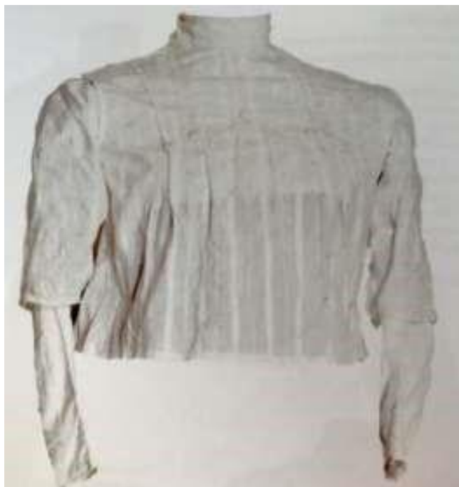
Рисунок 7. Лиф от наряда типа «парочка»