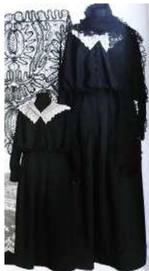
Рисунок 5. Наряд городской «парочка»