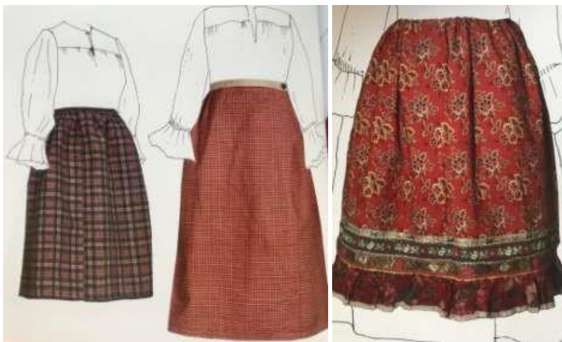
Рисунки 8, 9