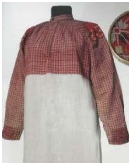
Рисунок 6. Рубаха составная