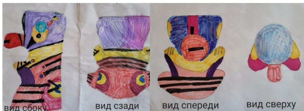
Рисунок 2. Эскизы игрушки в цвете с разных ракурсов (составлено автором)