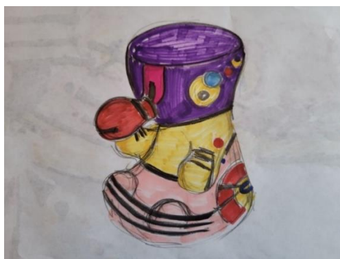
Рисунок 3. Эскиз игрушки в 3D формате (составлено автором)