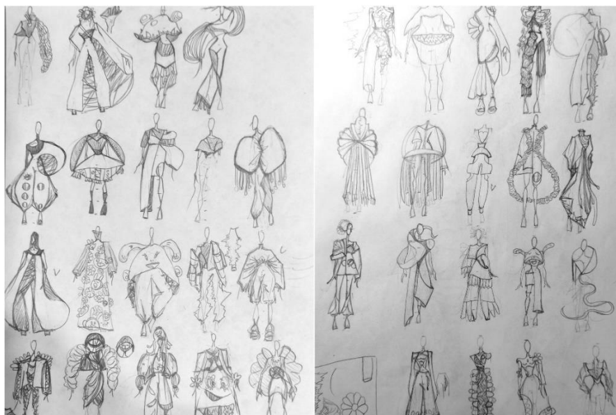
Рисунок 2. Форэскизы (составлено автором)