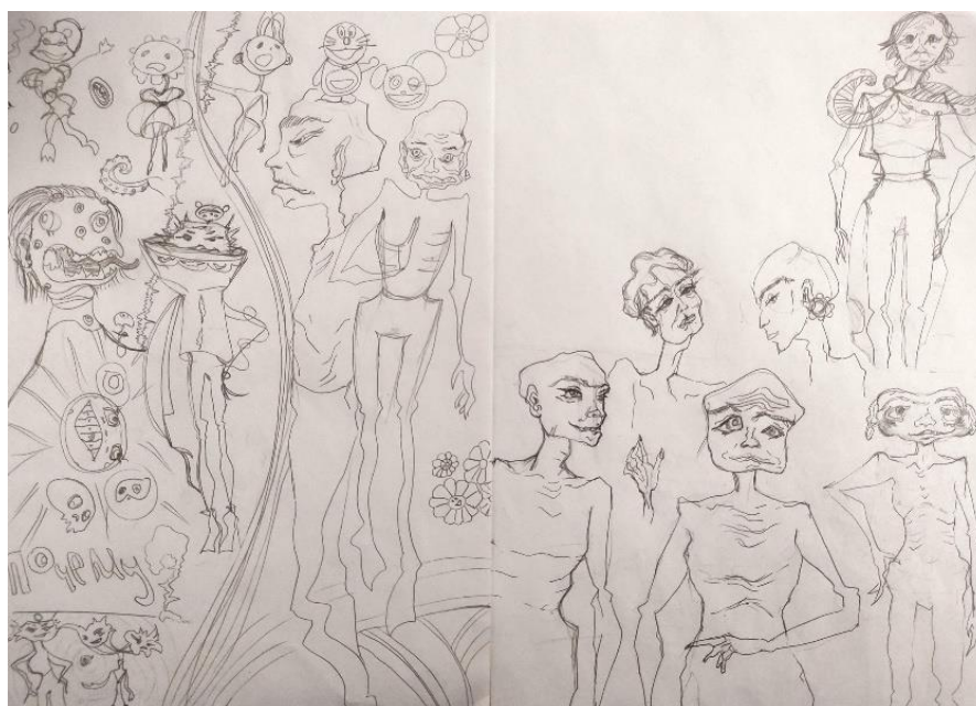
Рисунок 1. Основные формы, детали и персонажей (составлено автором)

Вначале я выявила основные формы, детали и персонажей, отдельно нарисовав их (рис. 1).