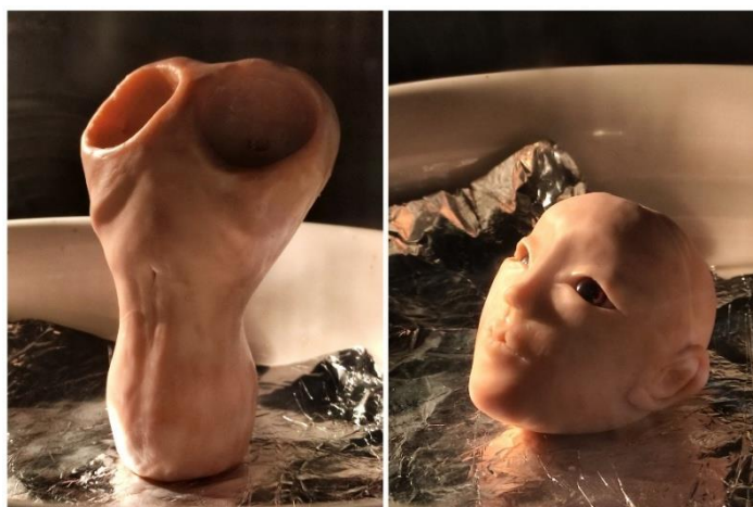
Рисунок 3. Процесс запекания слепленных частей (составлено автором)

Для изготовления шарнирной куклы выбран пластик Living Doll, запекаемый при 130°C. Ниже (рис. 3) представлен процесс запекания слепленных частей.