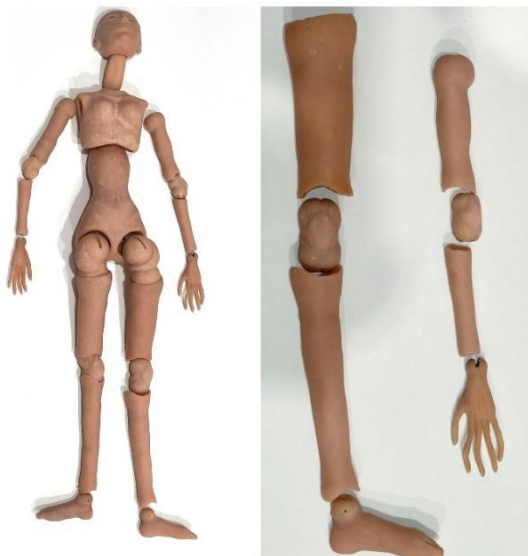
Рисунок 4. Детали куклы (составлено автором)

В качестве стилизации у куклы удлиненные пальцы и ноги, внешность схожа с японской: узкая переносица и разрез глаз.