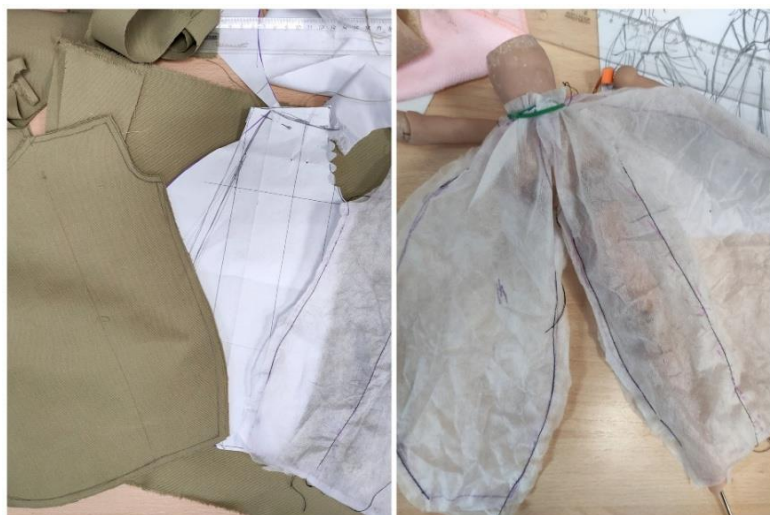
Рисунок 5. Выкройка (составлено автором)

Выкройки построены с помощью макетирования по выбранным моделям из разработанных форэскизов.